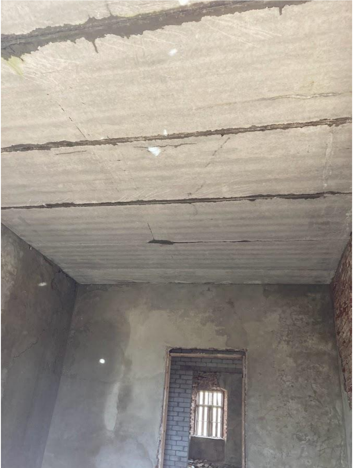
Pilt 4 Remondi käigus üles laotud ning krohvitud telliskiviseinad ning betoonplokkidest esimese korruse lagi.