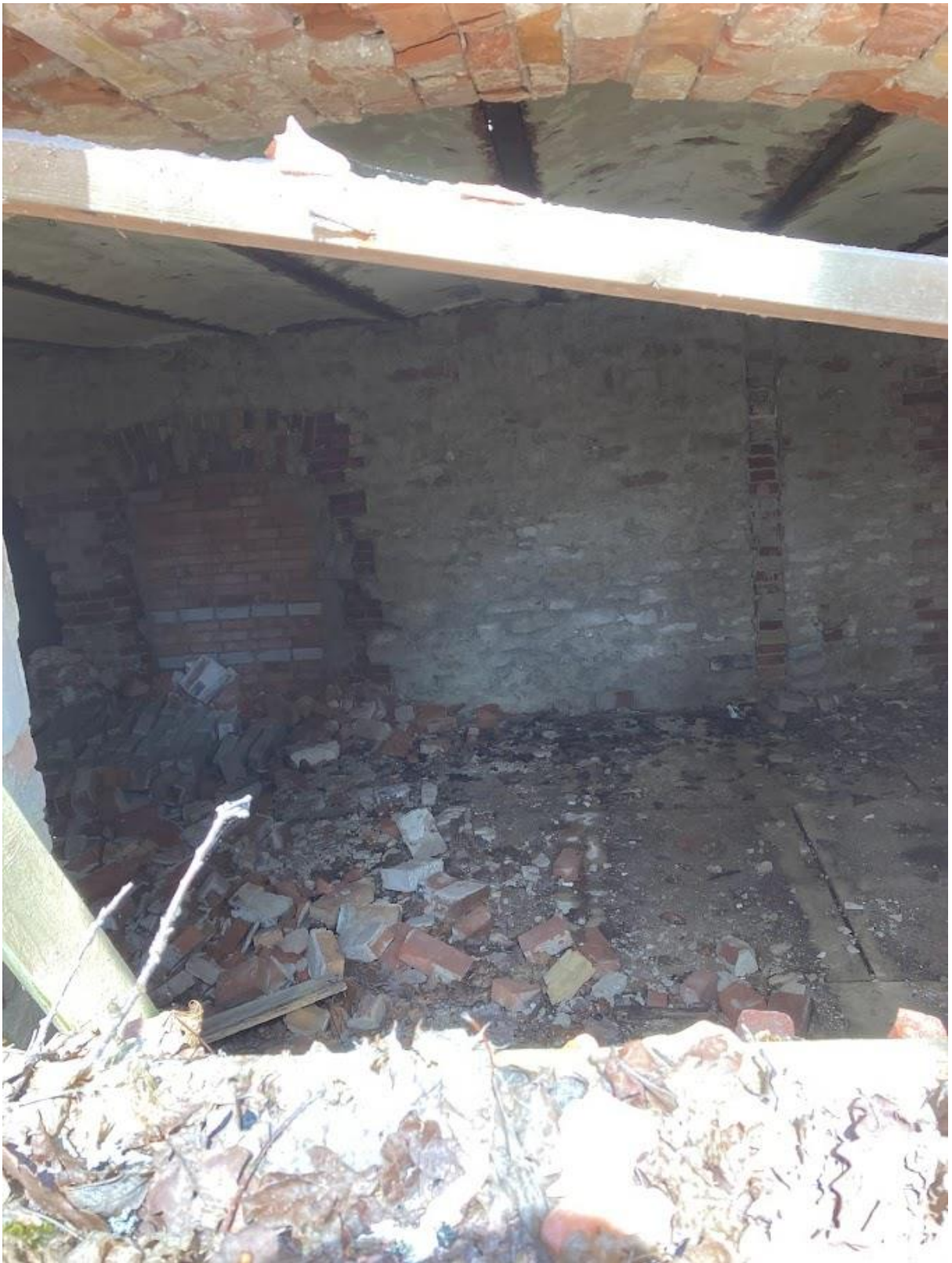
Pilt 5 Keldrikorruse võlvlagi ning kinni müüritud ava.