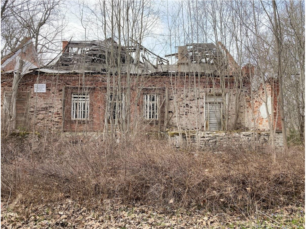
Pilt 8 Kõige kehvemas seisus on hoone idakülg. Kahest puitverandast on järel vaid paekivist vundament. Ülal on näha katuse äärmiselt õnnetut seisukorda.