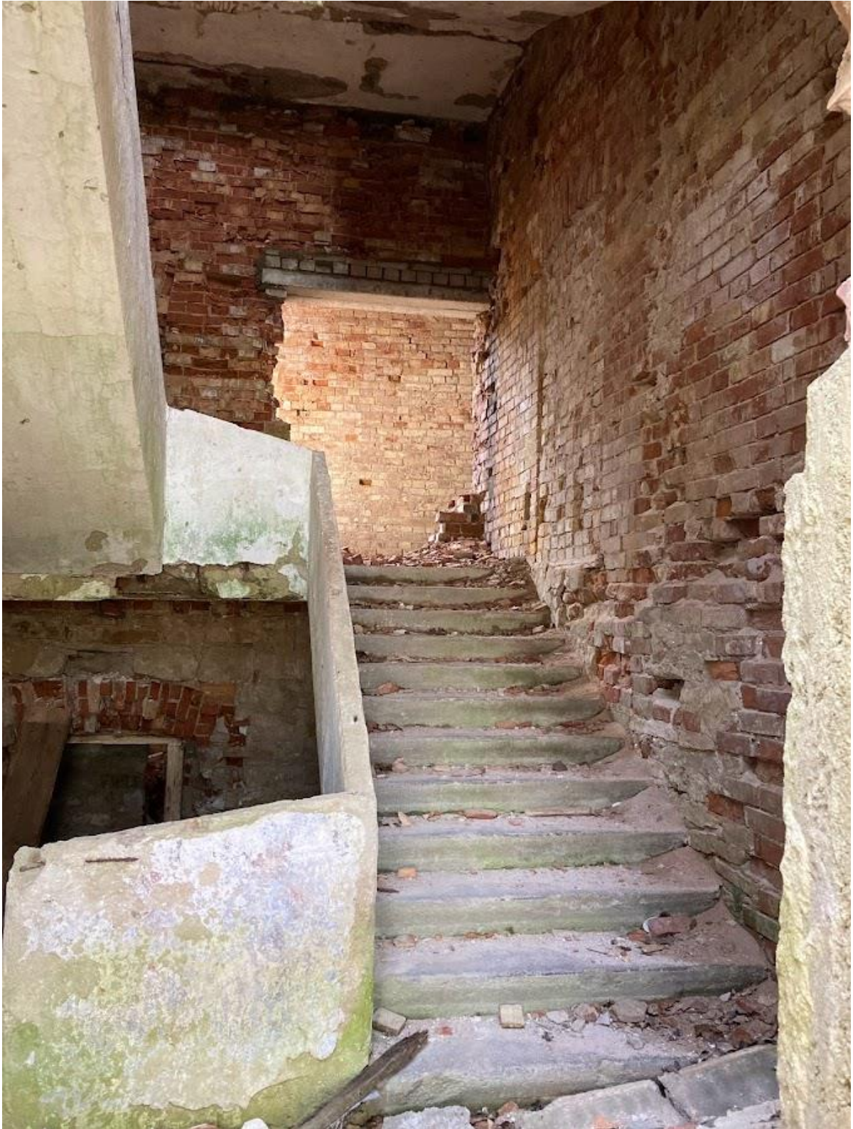
Pilt 2 Kehvas seisus pudenevad siseseinad ning inetu „lappimistö“. Lisaks betoonvaluga trepp ning niiskusest tekkinud rohetavad kahjustused.