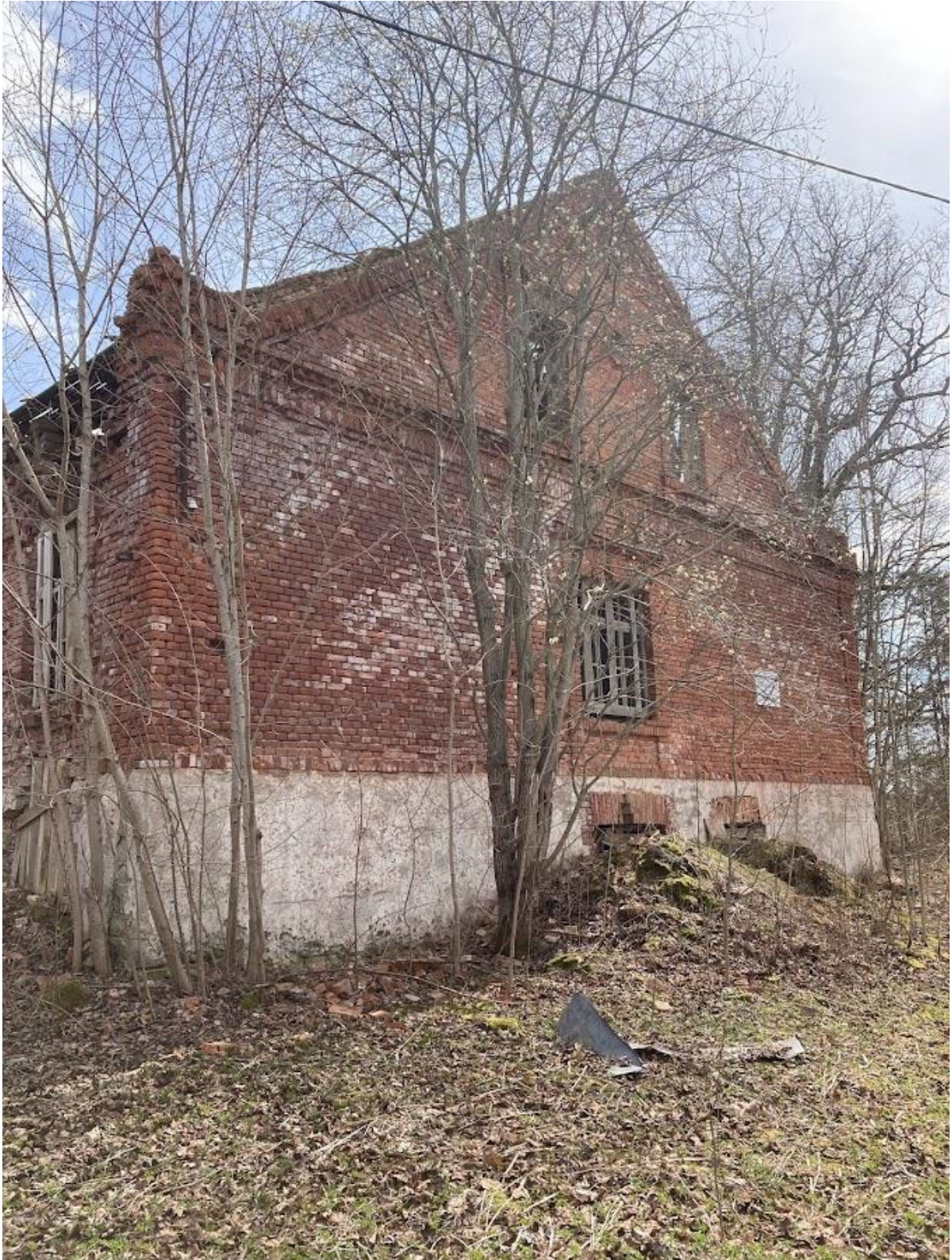
Pilt 7 Hoone läänepoolne otsavaade. Kogu hoone ümbrus on tugevalt võsastunud ning hoonele liiga lähedal kasvavad puud tuleks eemaldada.