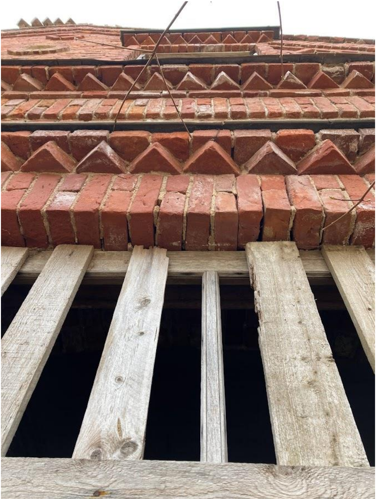
Pilt 3 Laudadega kinni löödud puitaknad ning akende kohal olev hammaslõikeline simss.