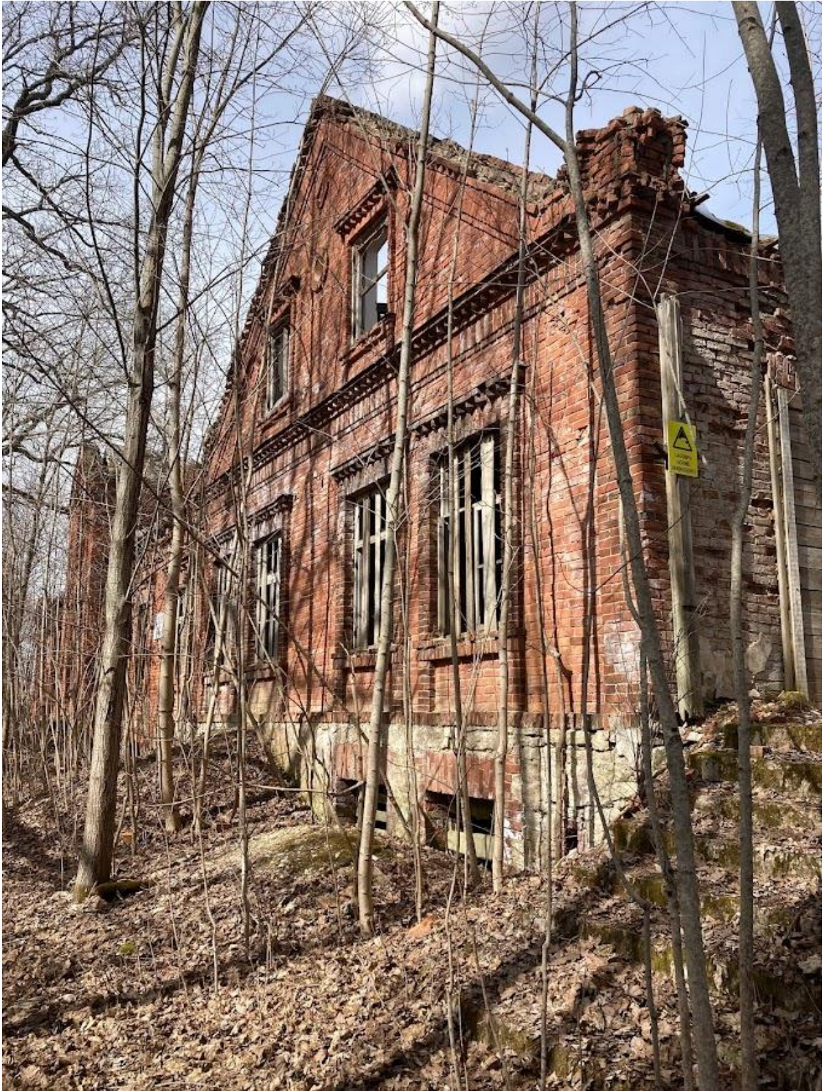
Pilt 1 Hoone sammaldunud peatrepp ning krohvi alt paljanduv soklikorruse paekiviladu. Niiskusprobleem avaldub soklikorruse äärde kuhjatud pinnase ümbruses olevates rohelistes laikudes ning kohati valge kihiga kaetud tellistel.