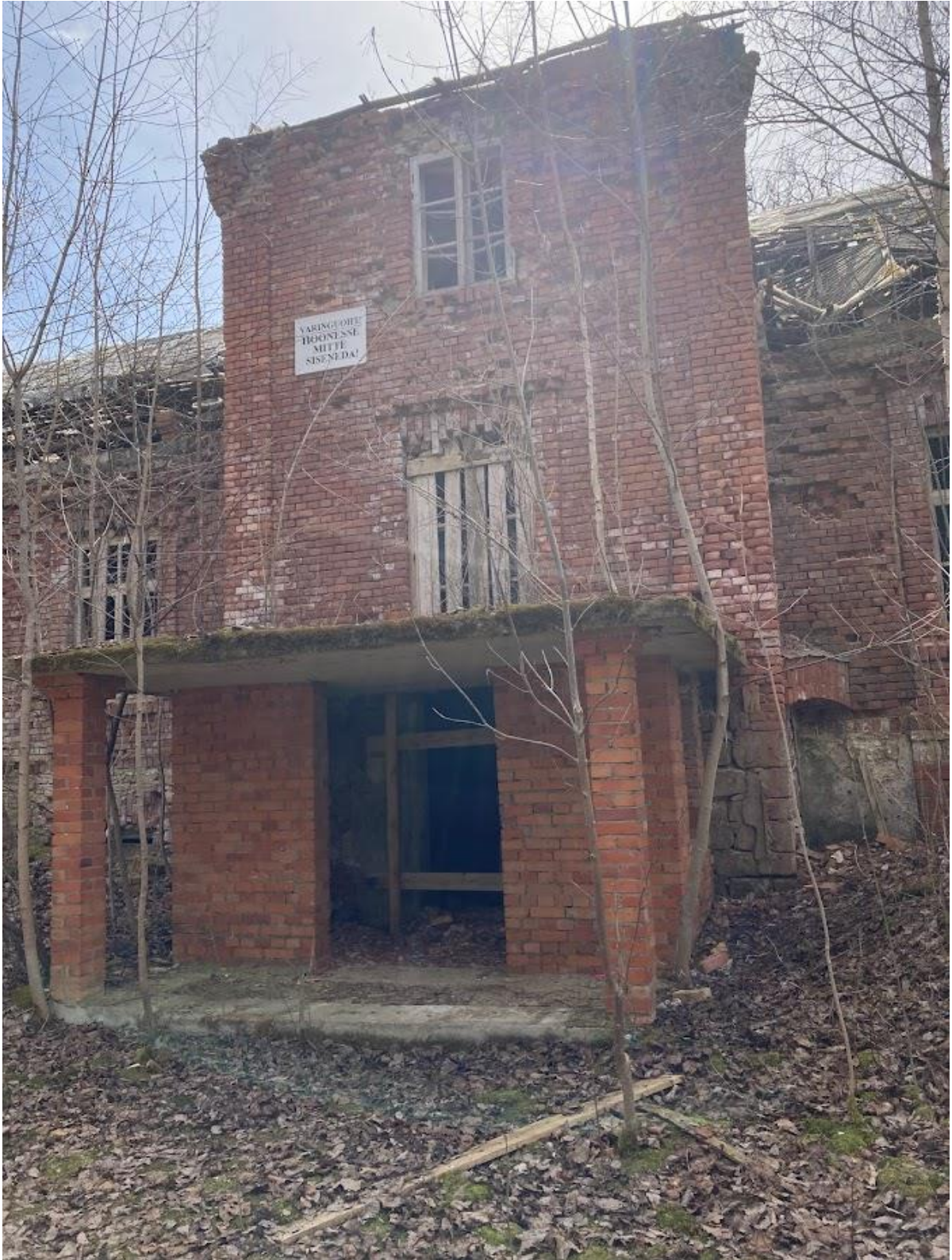
Pilt 6 Hoone põhjaküljel asuv hilisema ümberehitusena valminud sissepääs, mis ei harmoneeru ülejäänud hoone arhitektuuriga ning mõjub kohatult.