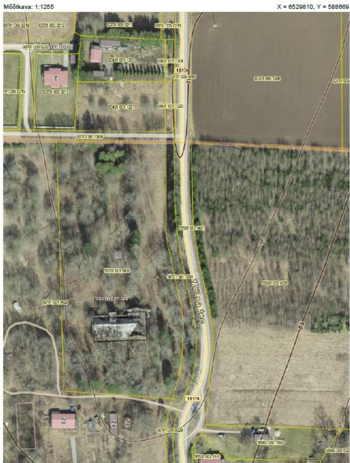
Illustratsioon 1 Präama mõisa asendiplaan Maa-ameti kaardil 26.04.2022