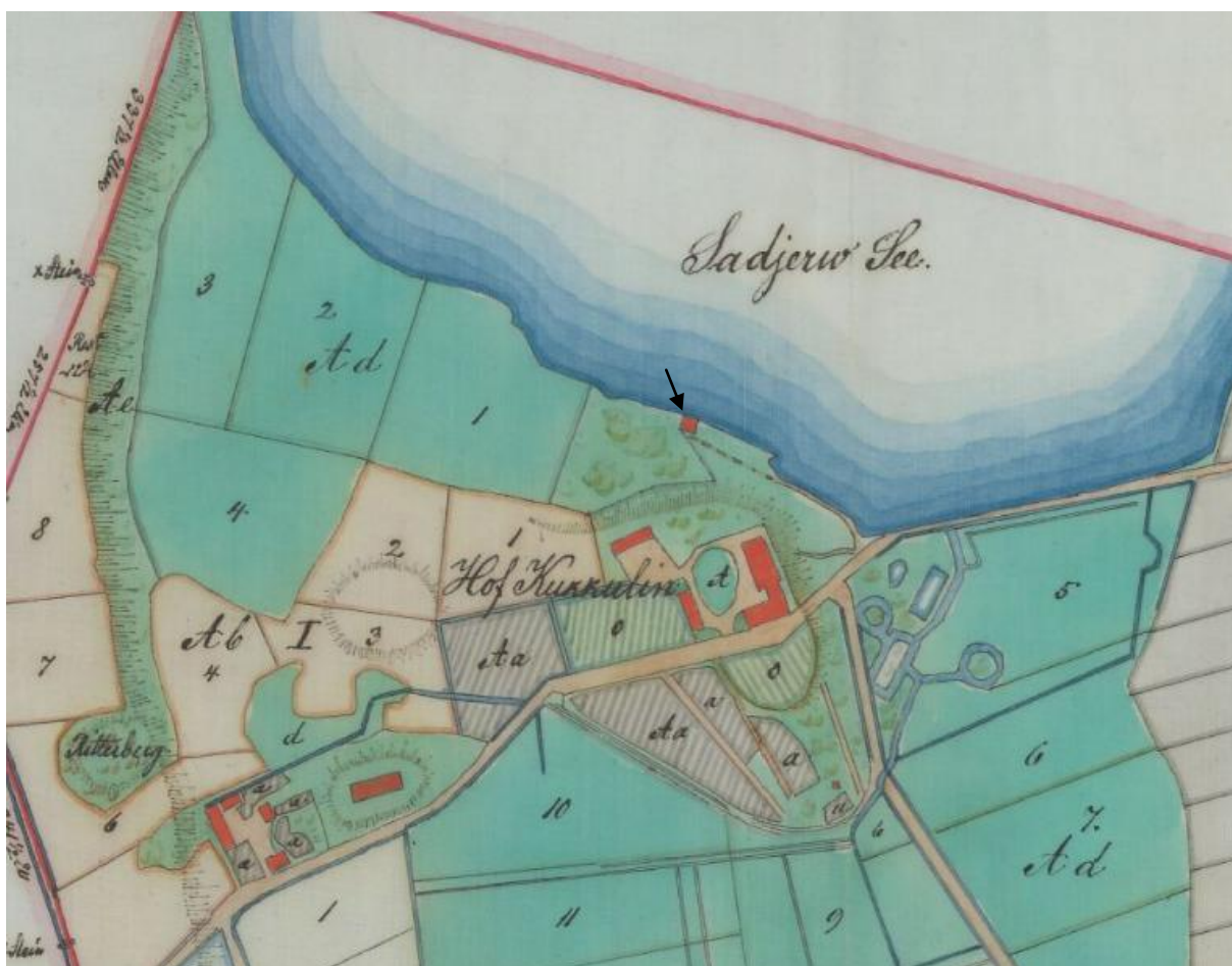
Joonis 3 VÄLJAVÖTE - Charte des im Livländischen Gouvernement, Dörptschen Kreise und Ecksschen Kirchspiele belegen privaten Gutes Kukkulin (1899, aluskaart on valminud 1885). 23

↙ - Kukulinna mõisa teenijatemaja asukohal paiknev hoone