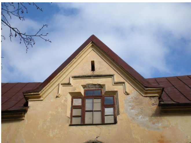
Foto 9 – Kahjustused hoone nurgal (kagu) (30.04.2009)