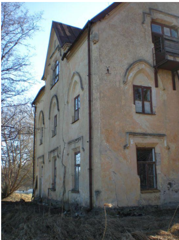
Foto 4 – Kirdepoolne otsafassaad (30.04.2009)