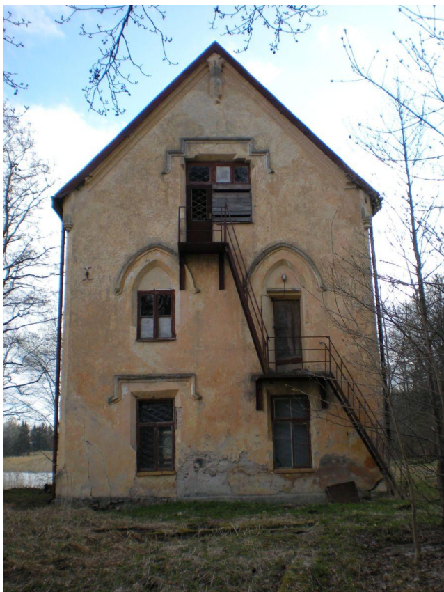
Foto 6 – I korruse akna näide (järvepoolisel fassaadil) (30.04.2009)