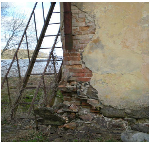
Foto 11 – Kahjustused hoone sokliosas (kirre) (21.04.2009)