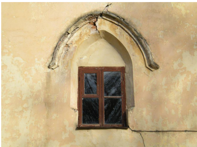
Foto 8 – Pööningukorruse akna näide (esifassaadil) (30.04.2009)