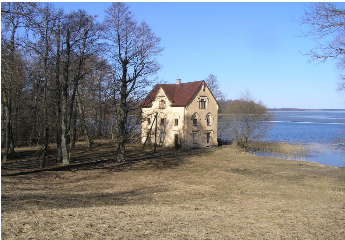
Foto 2 – Vaade esifassaadile (30.04.2009)