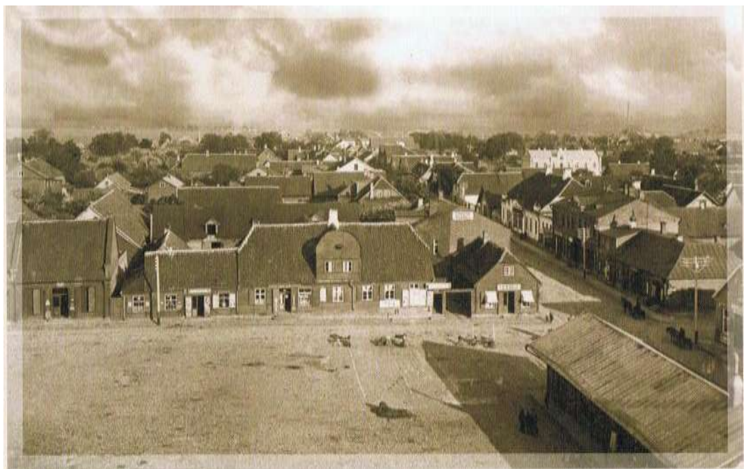
Vaade Võru linnale luteriusu Katariina kiriku tornist. O. Haidak, Narva, 1930. aastad.