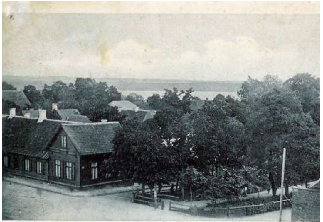
Werro. Chatarinen Allei. Verlag v. J. Paio, Werro.