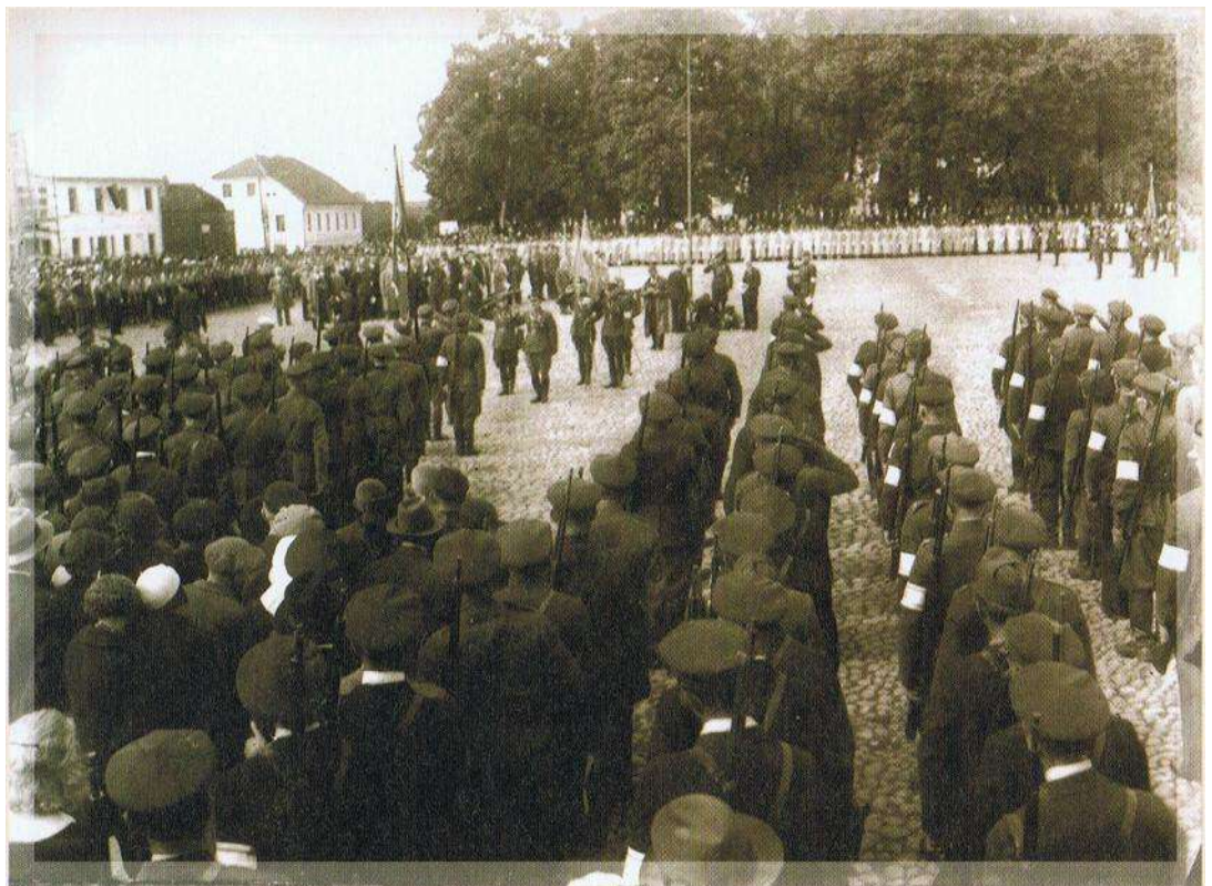
Noorte püha Võrus. J. Pajo, 1923.