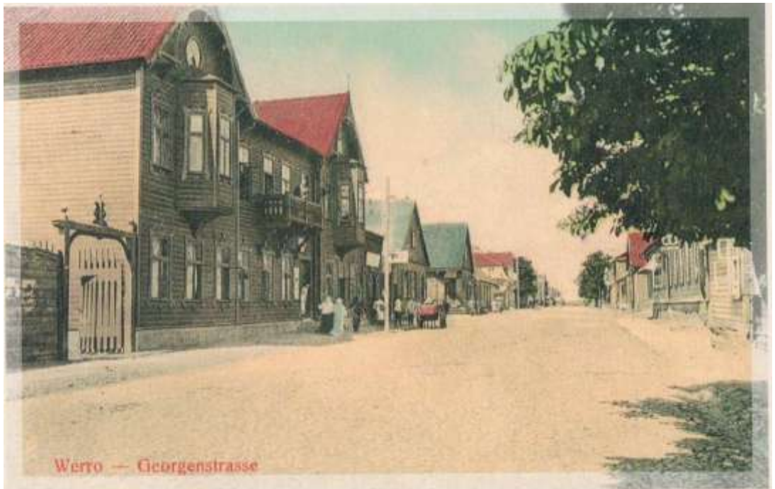
Jüri tänav, pildistatud Vabaduse ja Jüri ristmiku ja Tartu tänava suunas. Ernst G. Svanströmi kirjastus, Stockholm, Walter von Gaffroni kirjastus, Võru, 1910. aastad.