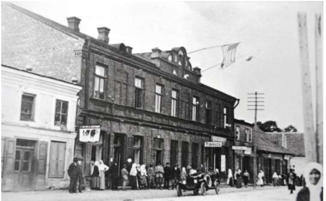
Võru linna raekoda, milles praegu asuvad linnavalitsuse ametruumid.