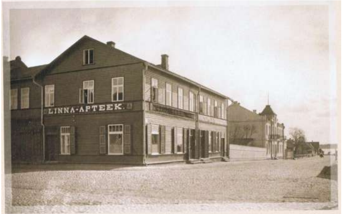
Jüri ja Kesk (Vabaduse) tänava nurk. Võru Linna-Apteek avati 1914. aastal. Apteegimajast järve pool Vabaduse tänaval on näha kivimaja, mis ehitati suuremate korteritega üürimajaks (1911, A. Jacoby), pärast I maailmasõda ehitati ümber kohtumajaks. Jaan Niilus, Võru, 1920. aastad.