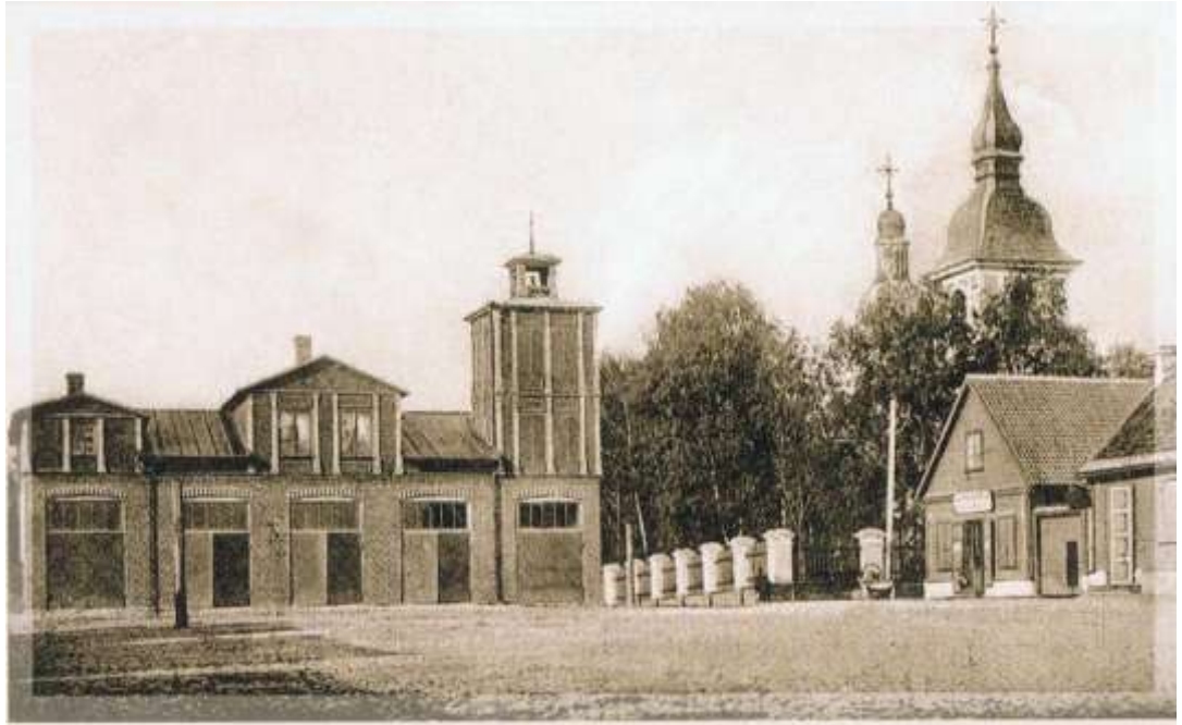
10. Pritsimaja turuplatsi ääres. P. Toonekure kirjastus, Võru, 1910. aastad.