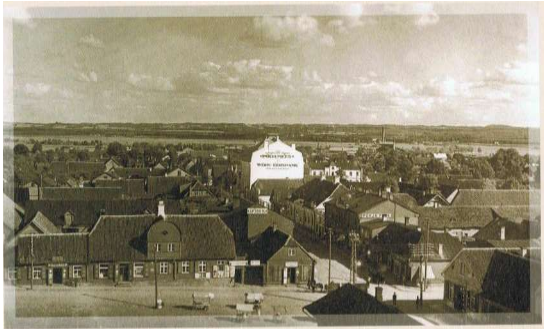
8. Vaade Võru linnale Katariina kiriku tornist. O. Haidak, Narva, 1922–1937.