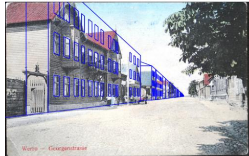
Ill. 3. Algse linnaplaneeringu idee.

Kas selline etapiviisiline ehitusmassiivi suurendamine ei paista olevat sisse kirjutatud juba linna algplaneeringusse. Raske on uskuda, et Võru linn planeeritigi olema väikeste baltisaksa tüüpi hoonetega agulilinnake igavesti. Linna planeerijad nägid kindlasti selles suurt tulevikku. Eeskujud ei olnud mitte naaberküla või linn vaid ikka Peterburi, Pariis, London jne. Kahjuks pole leitud veel linna algse planeeringu täit dokumentatsiooni. Arvan isiklikult, et need ideed ja planeeringu põhimõtted on kuskil väga konkreetselt kirjas, kuid pole veel sattunud ei minu kätte ega ka ühegi teise eestlase kätte. Samuti on kadunud Võru linna asemel olnud vana Võrumõisa plaan. Säilinud on ainult üks küsitava väärtusega plaan Broze kogus 2 .