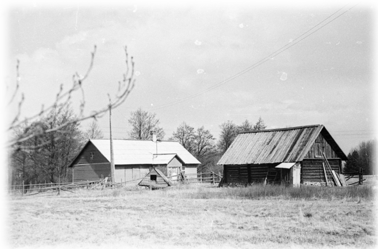
Illustratsioon 8, Elumaja, laut ja maakelder (ladu)