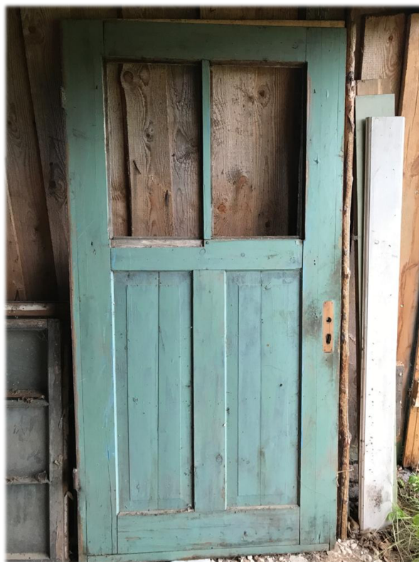
Illustratsioon 27, Vana eeskoja uks