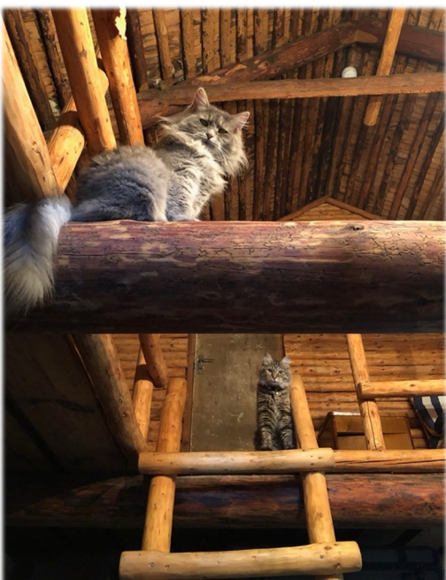
Illustratsioon 20, Avatud rehetuba