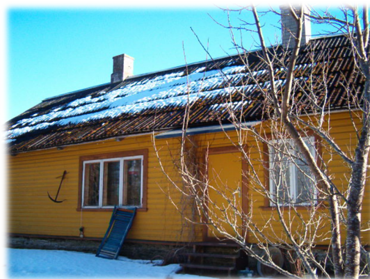
Ill. 11, Muudatused 1976-1980