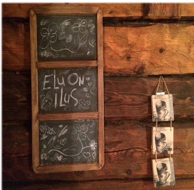
Illustratsioon 21, Puhastatud ja õlitatud palksein

Rehealusesse ehitatud uute tubade renoveerimine on hetkel käsil. Ühe toa seinad on palgini puhastatud (ill 22), teise toa seinu veel ootab sama tegevus (ill 23). Nende kohal olev katusealune tuba on palgini puhastatud (ill 24) ja ka põrand kuni vahelae palkideni on eemaldatud (ill 25)