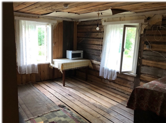
Illustratsioon 22, Palgini puhastatud.

Katusealuse toa ja elutoa vaheline sein on hetkel kooritud roigastest sein, mis ülejäänud interjööriga kuidagi ei sobitu.