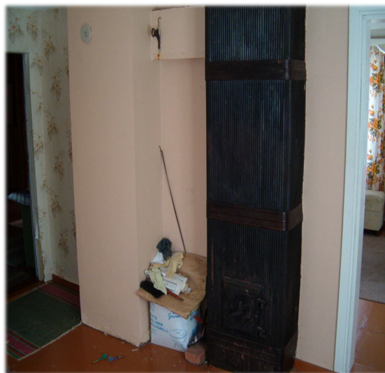
Illustratsioon 29, Laineplekiga kaetud ahi.