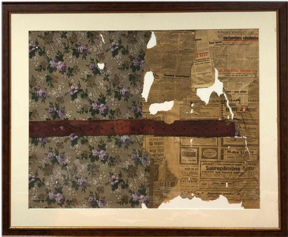
Illustratsioon 16, Kollaaz