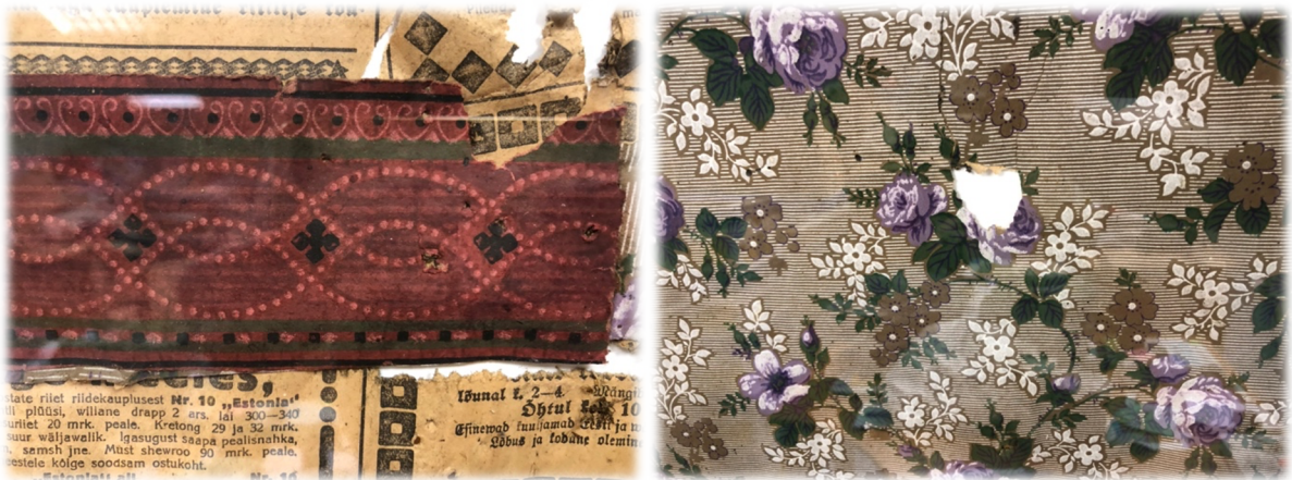
Illustratsioon 17, Kambrite vanad tapeeditükid

Täna on köögi ja tagakambri seinteks puhastatud palgid (ill 18 ja ill 19). Kambrite laes olnud vineerplaadid on eemaldatud. Kambrite lakke on nende hea seisukorra ja kauni välimuse tõttu jäetud vana lai laudis, mis vineeri alt välja tuli. Teise korruse põrandaks kambrite kohal on uus laudis.