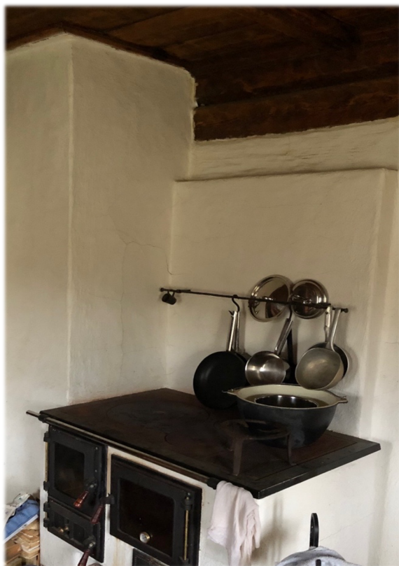
Illustratsioon 28, Puupliit köögis

Majal on kaks korstent, millest kambrite ja rehetoa korsten on uus, laotud punastest tellistest ja viimistletud lubikrohviga. Katusest väljapaistvad osad on kambrite küttekollete ehituse käigus saanud uued korstnapitsid ja krohvi.