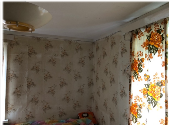
Illustratsioon 23, Remondi ootel tuba