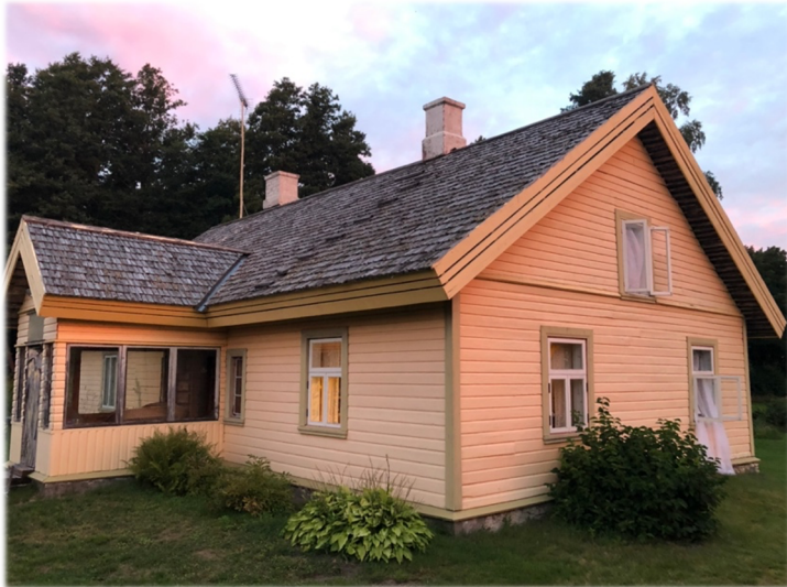
Illustratsioon 15, Maja praegu