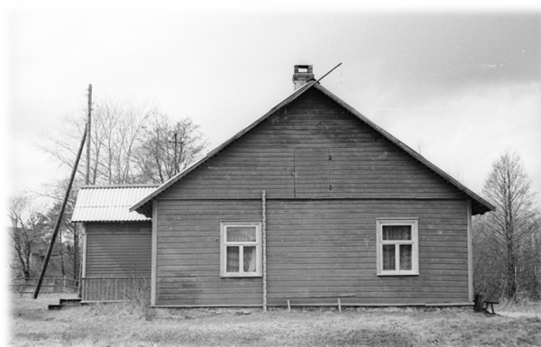
Ill. 12, Algne külgvaade