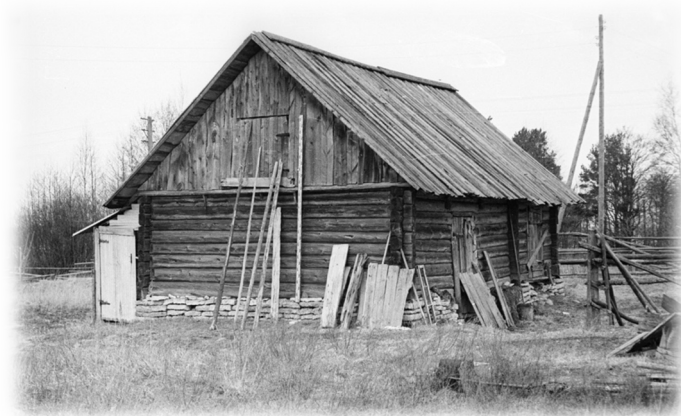
Illustratsioon 5, Laut ja nurgas välikäimla

Ajalooliselt on Vanakõrtsi talu maad asunud kahel pool teed (eeldatavasti pidi kõrtsi eest tee ju läbi minema). Tänapäevaks on need maad jagatud kaheks kinnistuks: Vanakõrtsi ja Sireli. Praegu on tollaegse talu hoonetest säilinud elumaja (ill 9) ja laut (ill 5). Keldri (ill 7) ja jääkeldri (ill 6) asukoht on vanu pilte vaadates tuvastatav. Sauna ja aida asukohta mäletab praegune omanik tema lapsepõlves alles olnud vundamentide järgi. Saun ja jääkelder asusid elumajast mere pool ja kelder (ladu) koos lauda ja aidaga teisel pool teed. (ill 8)