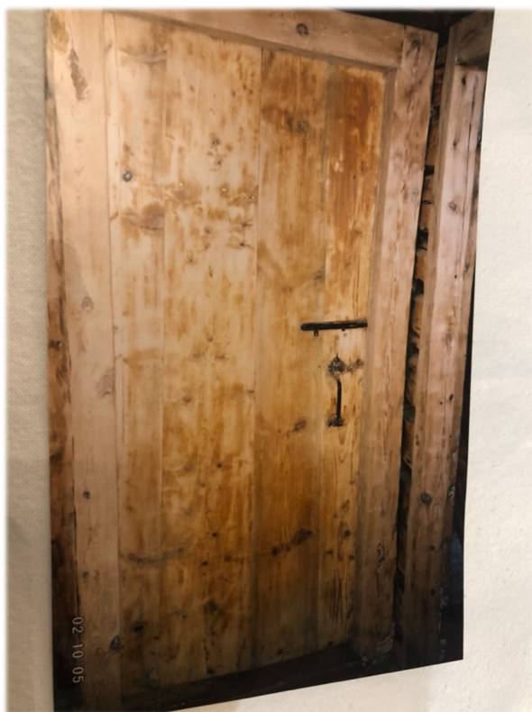
Illustratsioon 26, Sahvri uks

Säilinud ja kasutuses on ainult üks vana originaaluks: sahvri uks (ill 26). Laudast leidsime ka ühe sinna hoiule pandud kauni tahvelukse (ill 27), mis on algselt olnud eeskoja uks (ill 9). See uks koos ühe laudast leitud kuueruudulise aknaraamiga ootab restaureerimist ja läheb hiljem kasutusse katusealuse toa ukse ja siseaknana.