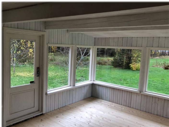
Illustratsioon 14, Merepoolne veranda

asemel suur kamin-ahi. Merepoolsesse külge maja keskossa lisandus valgusküllane veranda. (ill 14)