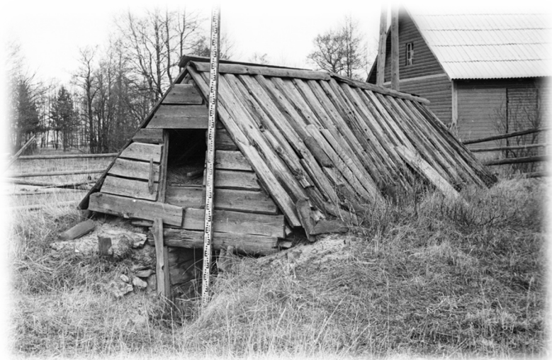
Illustratsioon 7, Maakelder (ladu)