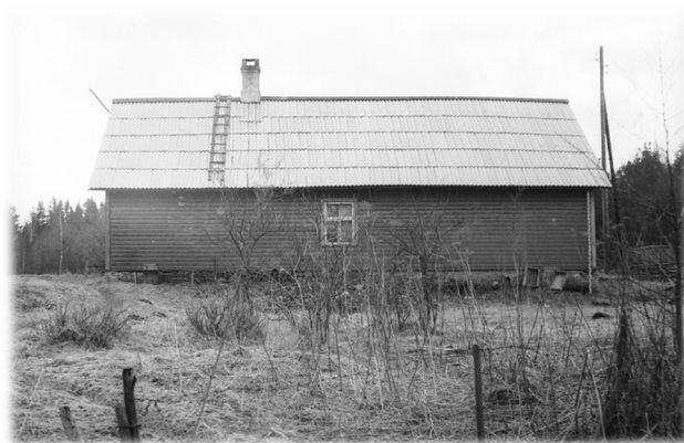
Ill. 10, Algne vaade elamule mere poolt

oma külmik, elektripliit ja kapike. Sellisena oli maja kaasomandina kasutuses 3 pärija vahel kuni 2005. aastan, millisest alates on majal taas üks omanik. (ill 10–ill 13)