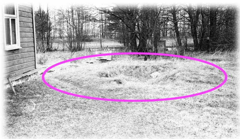
Illustratsioon 6, Jäakeldri kunagine asukoht