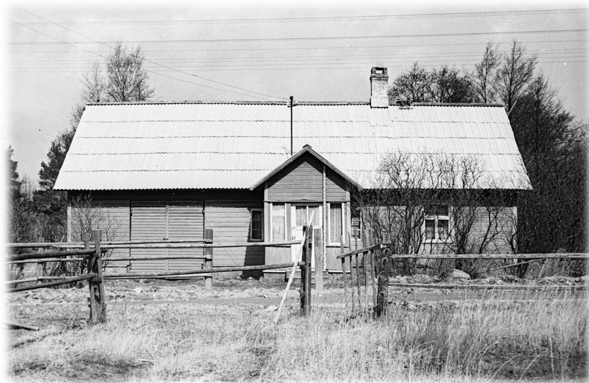
Illustratsioon 9, Rehielamu

Elumaja (ill 9) puhul oli algselt tegu vana rehielamuga, milles oli eeskoda, esik, sahver, rehetuba, eeskamber, tagakamber (paremal pool rehetuba) ja rehealune (vasakul pool). Seinad olid palgist, väljast kaetud laudisega, vundament paekivist ja katuseks pilpakatus. Põrandad ja laed olid lauast. Maja on ca 120 m 2 põhjapinnaga.