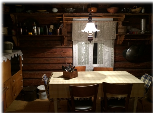
Illustratsioon 18, Köök

Rehetoa palkseinad olid seestpoolt kaetud lakitud kitsa püstlaudisega ja laudisest vahelagi oli lakitud tumepruuni värv-lakiga. Kui see läikiv tumepruun laudis laest sai eemaldatud ja tekkis suur avar ruum, kust paistis kaunis pilpakatus (ill 20), siis nii jäigi ja vahelage rehetoa peale enam tagasi ei ehitatud. Palkseinad vabastati laudisest ja puhastati ning õlitati ja kaunistavad nüüd avarat elutuba (ill 21).