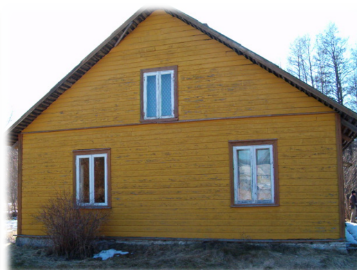
Ill. 13, Muudatused 1976-1980