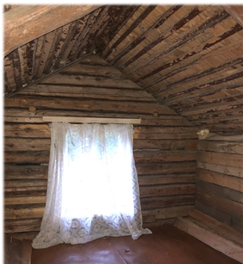
Ill. 24, Palgini puhastatud ülemine tuba.