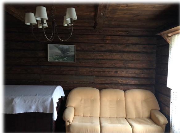
Illustratsioon 19, Tagakamber