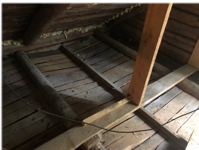
Ill. 25, Ülemise toa avatud põrand