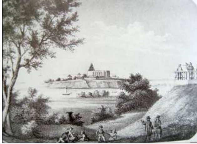
Pilt 1: L. H. Peterseni koloreeritud litograafia Pirita kloostri varemetest (1970)

Ka teises maailmasõjas ei jäänud klooster puutumata ja sellest jutustab mürsuauk kloostrikiriku lääneviilus.