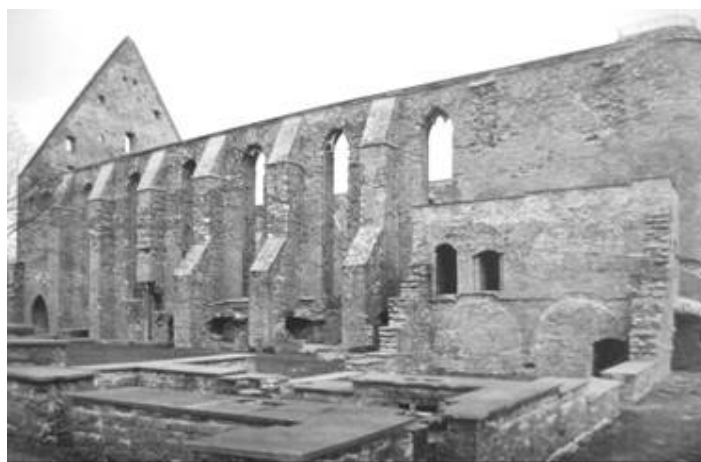
Pilt 2. Pirita kloostrikirik.

Keskaja lõpuks küündis Birgitta ordu kloostrite arv seitsmekümneni. Peale emakloostri Vadstenas on neist ehituslikult kõige ulatuslikumalt säilinud Pirita klooster Tallinnas. See on kahtlemata üks põhjusi, mis on Pirita kloostri varemetele toonud teiste Eesti ehitismälestistega võrreldes kõlavama rahvusvahelise kuulsuse, tõdeb L. Lapin 1973. aasta konserveerimise projektdokumentatsiooni koostades. 51