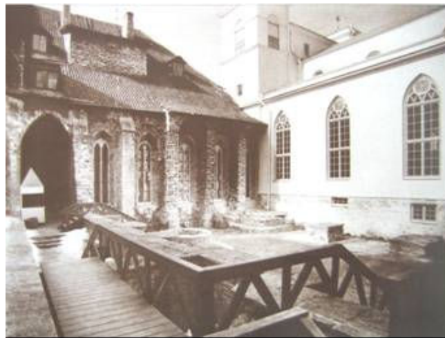
Pilt 3: Püha Katariina kloostrisisehoov.

Võrreldes kahe kloostriga mälestisena aktualiseerimist tuleb nentida, et Pirita kloostris konserveerimiseks oli tunduvalt kergem leida kontseptuaalset alust, kuivõrd alles jäänud ehitussubstantsi maht ise määras tema käitlemise eeskätt varemetepargina. Dominikaanlaste kloostris asend, tema ruumide komplitseeritud seisund ja kasutus erinevates tegevusvaldkondades muutsid ühtse mõtestatud konserveerimise ja restaureerimise alase lahenduse leidmise oluliselt keerukamaks.