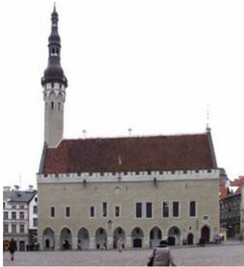
Pilt 4: Tallinna raekoda (2005)

15. sajandi alguseks oli Tallinn jõudsalt arenenud. Kaitsva ringmüüri sees olid enamik kohti täisehitatud ja siin-seal esines kahekorruselisi torntüüpi kivimajugi. Linnavõimu esindushoone vajas taas täiendavaid ruume ning üleüldse oli raekoda muu linnaga võrreldes – arvestades oma tähtsust – napi poolelise korrusega väiksepoolseks jäänud. Aastatel 1401-1404 asutigi ulatuslikele ümberehitustele. Ilmselt oli enne ehituste algust olemas konkreetne plaan, kuidas ja mida teha, sest juurdeehitused kasutasid üliratsionaalselt ära kogu olemasolevat hoonestust. Enam-vähem sarnasel kujul on raekoda säilinud tänapäevani. Hilisemate ümberehituste kohta väga palju materjale ei ole. Kodanikesaali lääneotsa kujutavalt anonüümselt ca 1665. aastast pärinevalt joonisel 69 on näha, et juba siis oli kodanikesaali laotud sekundaarne kivisein eraldamaks läänepoolt kahte võlvikut. Hiljemalt 1797. aasta suveks oli kodanikesaali läänepoolne kolmandik kahekorruseliseks ehitatud. 70