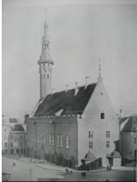
Pilt 5: Tallinna raekoda. 19. sajandi lõpp

lokaalseid ümberehitus- ja remonttöid. Kodanikesaali põhikorrusel ühendati omavahel mõned ruumid. Idapool lammutati paari võlviku vahelt aastatel 1838-1840 ehitatud vahelaed ja -seinad.