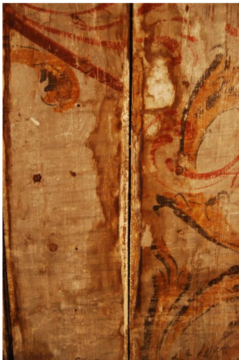
Väikeses ruumis „seenekolle”.