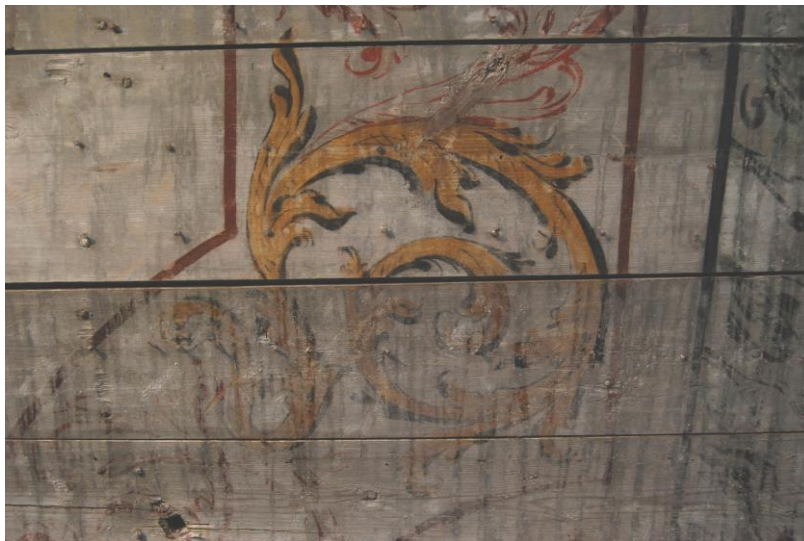
15. Maalingu puhastatud ja puhastamata pind.