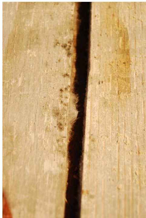
Suures ruumis hallitus.