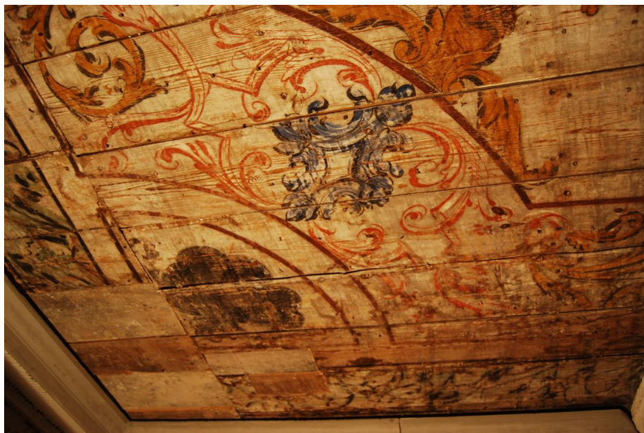
Puiduparandused väikeses ruumis.