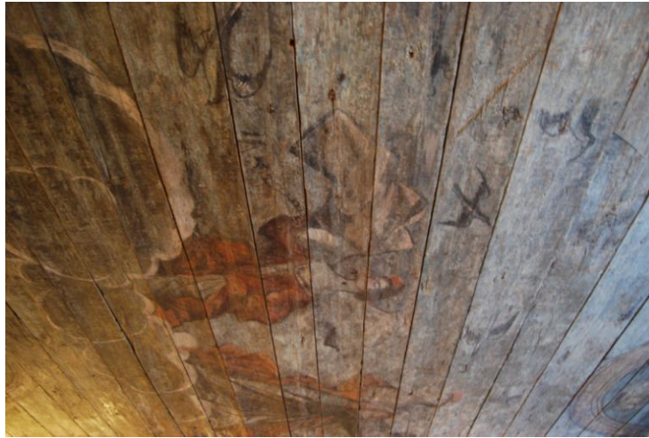
3. Dunkri 4 / 6 laemaaling, II korrus.