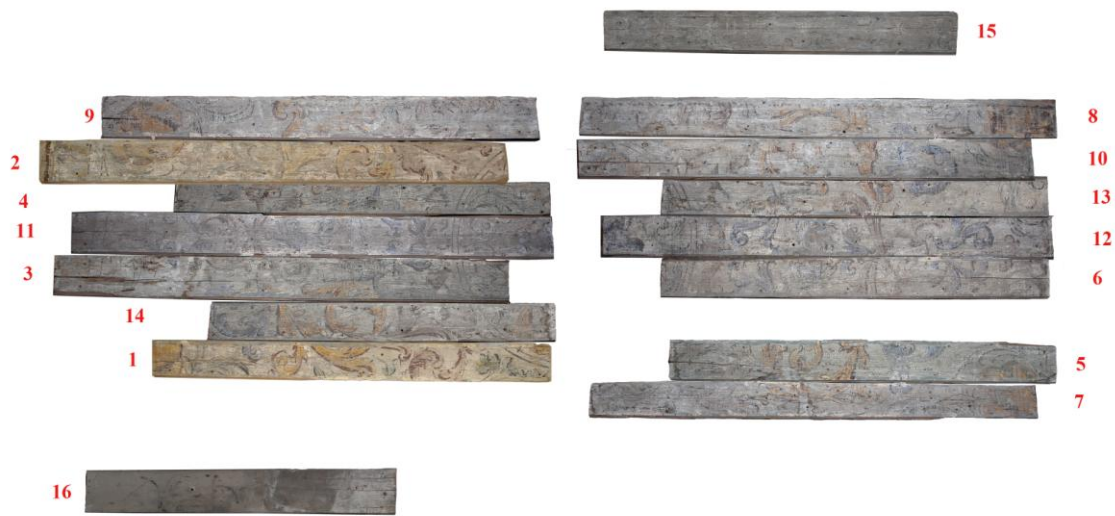
7. Sauna 4. Laudislae rekonstruktsioon.