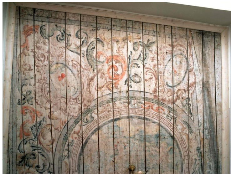
4. Pikk 12 laudismaaling.