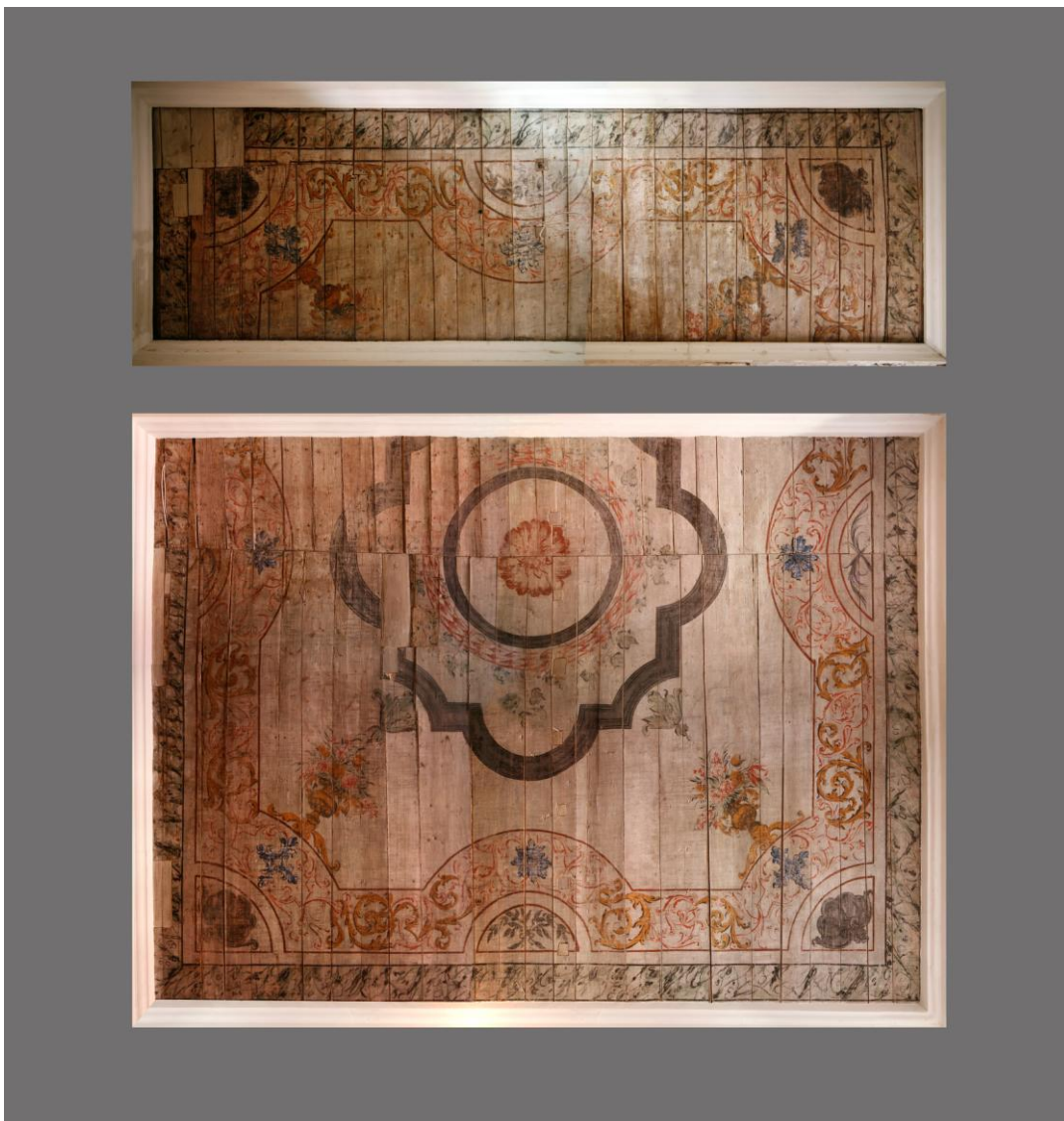
Rahukohtu 5 maalingutega lagi konserveerimis-restaureerimistööde käigus. Suurema ruumi lagi on üle poole toneeritud. 8. V 2013.