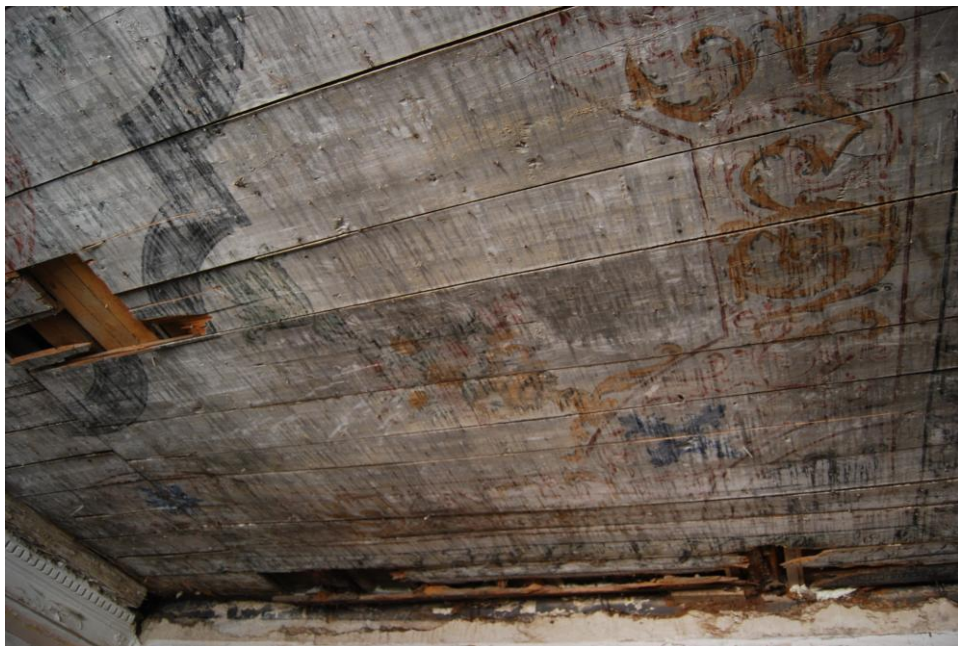
Puidukahjustused suures ruumis.