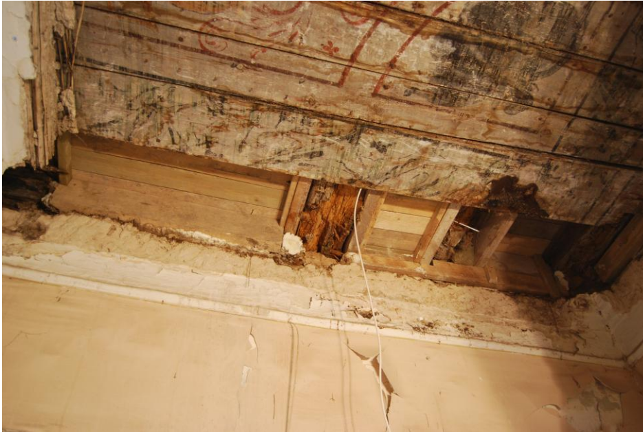
Puidukahjustused väikeses ruumis.