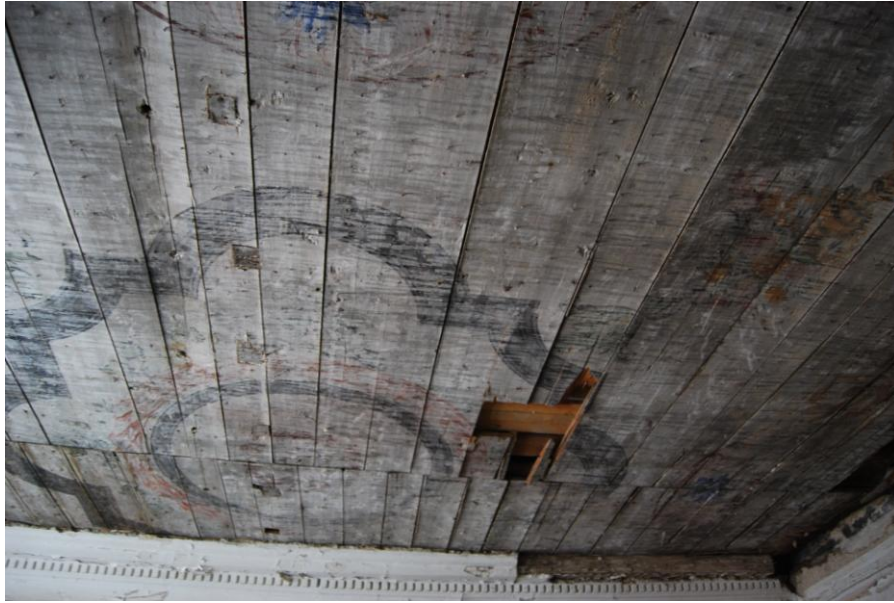
Lagi enne konserveerimist-restaureerimist (märts 2013).