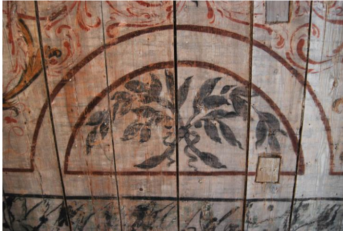
17. Toneerimata ja toneeritud maalingupiirkond.