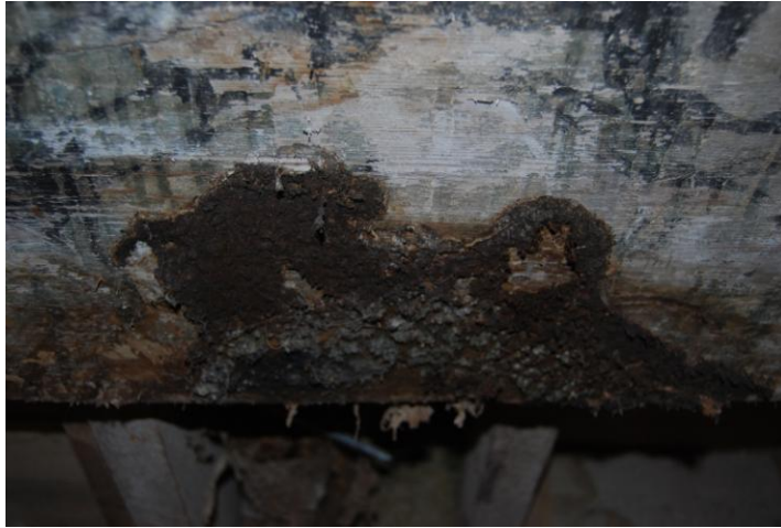
Väikeses ruumis „seenekolle”.