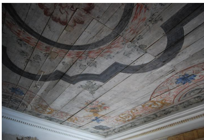
1. Rahukohtu 5 laudismaaling.

Kohtu 12 hoone esimese korruse ruumis asus (?) marmoreeringmustriga laudislagi, kuid kuna talalagede kataloogis selle kohta foto puudub, siis polnud illustratsiooni võimalik lisada. 19 Toomkooli 23 võib leida talade suhtes ristipidise laudisega lae, selle lae põhisõnum on kantud laudisele.