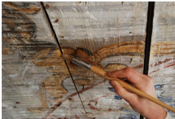
16. Maalingukihi kinnitamine.

Maalikiht immutati 5-protsendilise paraloid B 72- ga atsetoonis pintsliga otse maalingule kandes. Kinnitusprotsess toimus kahes etapis: kõigepealt kinnitati maalingu ornamendiosa või kogu maalingupind pintsliga õrnalt vajutades; teiseks kinnitati maalingukiht uuesti, eriti tähtis oli kahekordselt kinnitada ornamendi piirkonnad. Kui aga pärast kahekordset kinnitamist ikka veel värvikihi osakeste vahel piisavalt siduvust polnud, kanti maalingule uus paraloidikiht. Seal, kus maalikihil puudus side aluspinnaga, injekeeriti paraloidilahust lahtise maalikihi alla ning ettevaatlikult survet avaldades kinnitati aluspinnale. Õnneks tuli viimast probleemi harva ette.