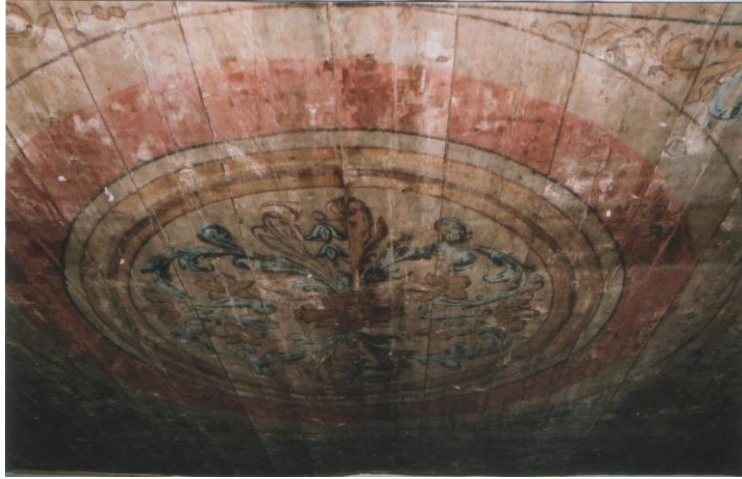
2. Dunkri 4 / 6 laemaaling, I korrus.