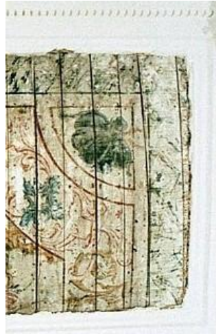
11. Rahukohtu 5 väiksema ruumi lagi 1997. aastal, detail fotost.