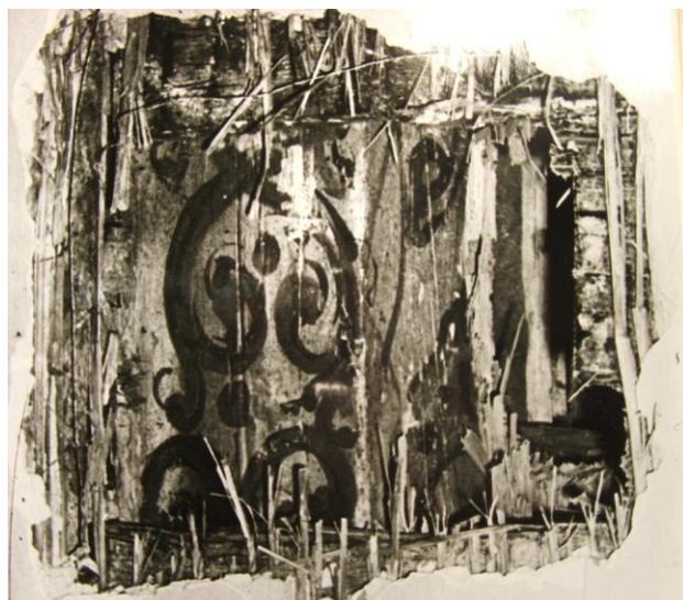
8. Lai 15, laedetail.