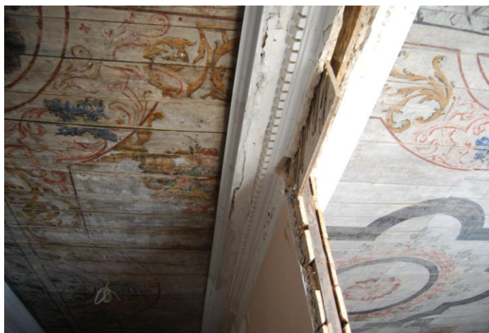
13. Vaade Rahukohtu 5 laemaalingule. Võimalik tulevase akna asukoht.

Maalingu terviklikku esteetilist ühtsust jääb kahjuks takistama 19. sajandil ehitatud vahesein, mida omanikul pole plaanis eemaldada. Ühelt poolt on mõistetav, et ei soovita nii suurt ruumi taastada – see pole praktiline – kuid teisest küljest aitaks vaheseina eemaldamine paremini taasluua maalingu ühtsust. Algselt tehti lagi ühe tervikliku ruumi jaoks, kuid hetkel ei pruugi esmapilgul tajudagi, et kahes ruumis on tegelikult üks- ja seesama laemaal. Viimaste rõõmustavate andmete põhjal plaanitakse kahe ruumi vahele aken teha, niiviisi oleks võimalik mingilgi määral maalingut tervikuna näha ning see oleks väga tervitatav.