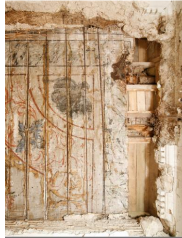
12. Rahukohtu 5 väiksema ruumi lagi 2013. aastal, detail fotost.