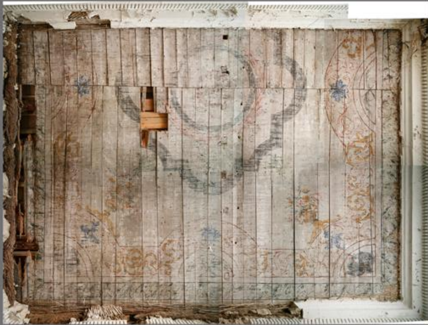
Rahukohtu 5 laemaaling enne konserveerimist-restaureerimist (märts 2013).