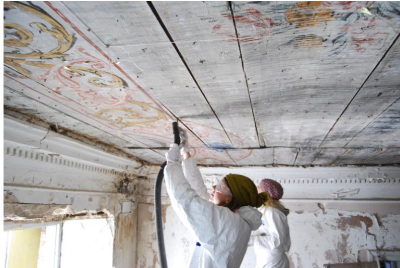
14. Laudisevahede puhastamine.

maalingut õrnalt tupsutades, seejuures pidevalt maalingukihi seisundit jälgides. Oht oli maalikihi liigset survet avaldada.