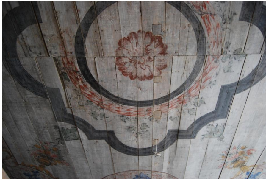
Lagi 14. mail 2013. Fotol on näha musta ornamendimotiivi rekonstruktsioon.