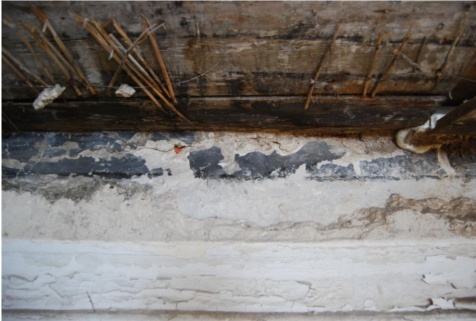
Rahukohtu 5, suurem ruum. Paksu krohvi alt paistab seinä (algne?) viimistlus.