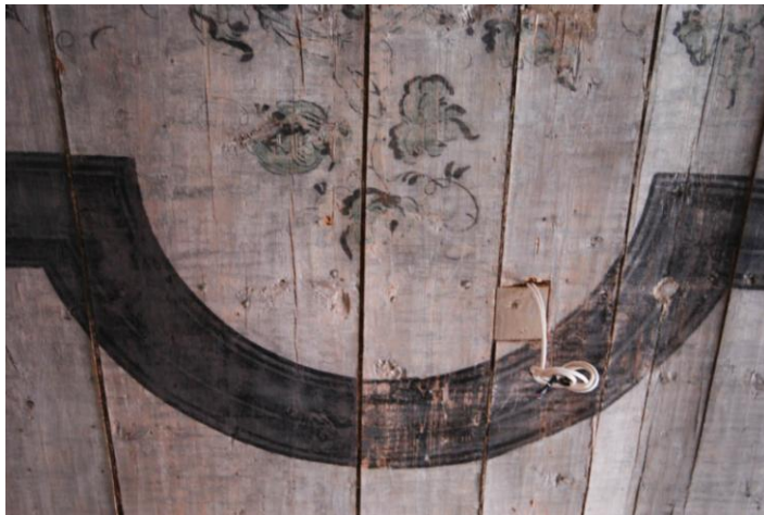
18. Toneeritud ja toneerimata maalingupiirkond.