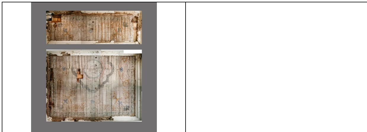
Foto enne konserveerimist