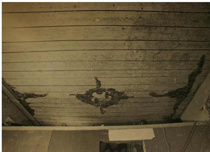
6. Suur-Karja 4 laudismaaling.