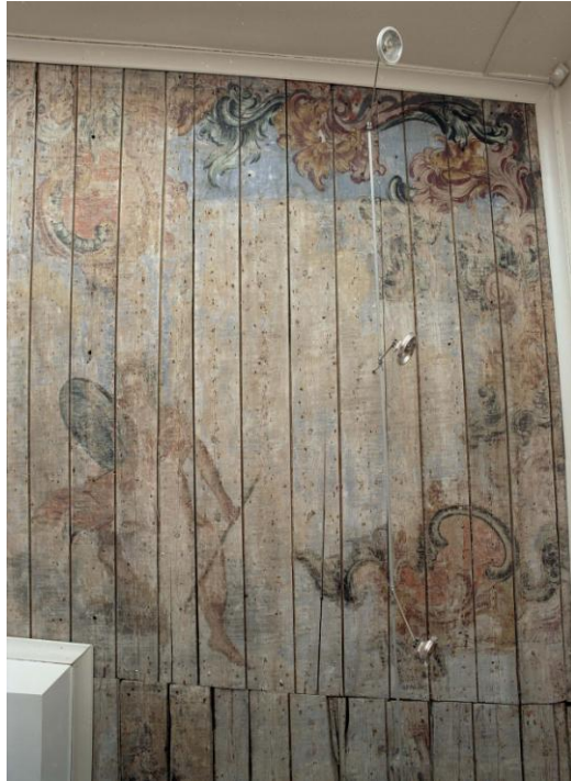
5. Pikk 12 laudismaaling.