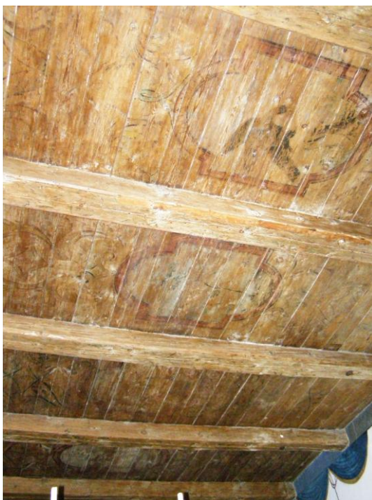
9. Toomkooli 23 maalitud lagi.