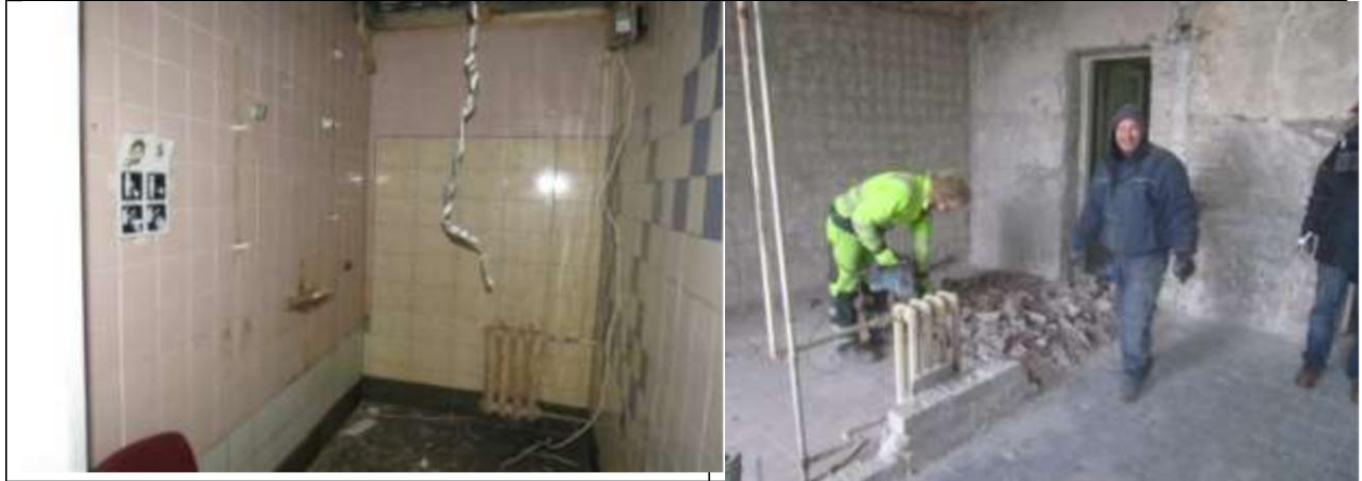
Sanitaarsõlmede blokk enne avamisi