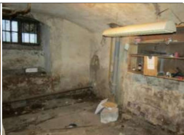
Keldriruum pärast seinavoodri eemaldamist