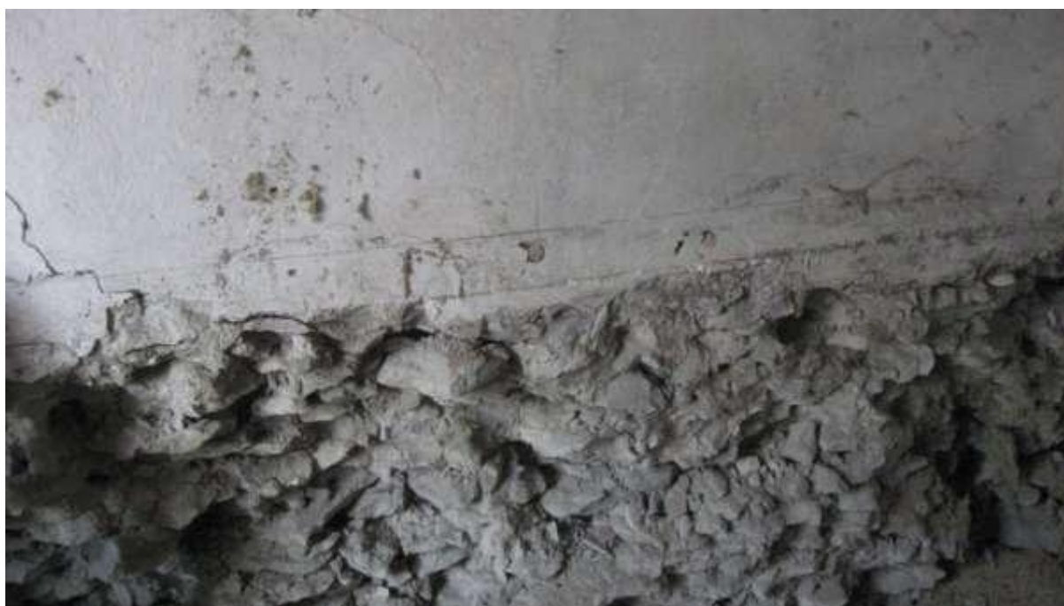
Lõhutud päkivist otsasein