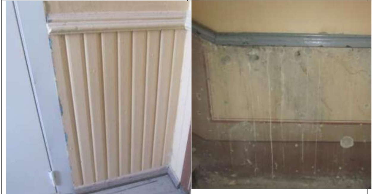
Trepihalli seinavooderdis enne eemaldamist