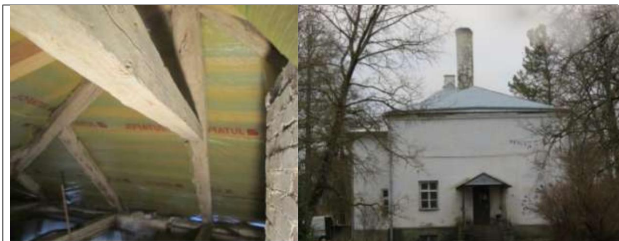
Otsahoone enne kipsseinte eemaldamist