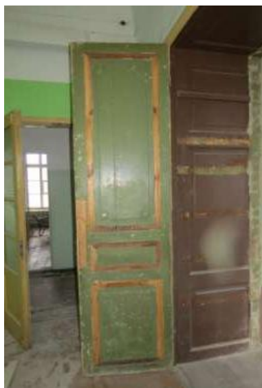
uksed ja piidad

Tiibustelt vineeri eemaldamise käigus selgus, et ukselehetede profiilid olid vineeri paigaldamise hõlbustamiseks maha raiutud. Ustel paljandus kohati originaalvärvi, mida saab uste edasise restaureerimise protsessis arvestada.