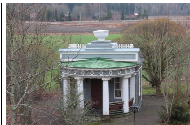
C.L.Engeli suvepaviljon Moisio mõisas