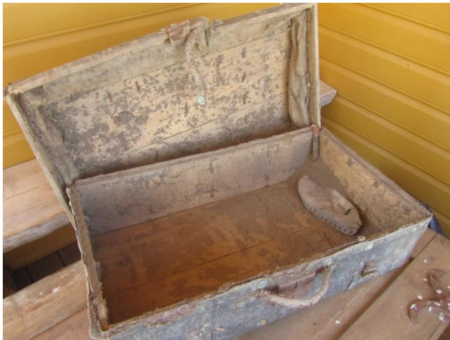
Kohver, leitud Kernu mõisast.

Meie oma edasises restaureerimistöös lähtume Engelile omasest käsitlusest ja kavas on ka väikese, Engelile pühendatud muuseumi rajamine. C.L.Engel oli väga kiire joonistaja ja tema projektid on esteetiliselt nauditavad ka eraldiseisvatena projekteeritud hoonetest.