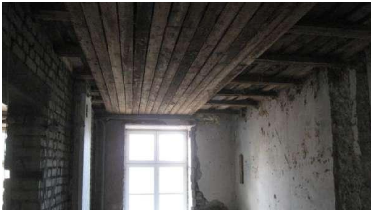
Otsahoone 2. korruse ruum pärast kipsseinte eemaldamist