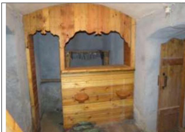
Keldrisse ehitatud baar

väga tugevasti niiskusest kahjustunud enamasti krohvitud sein.