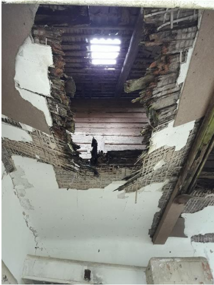
Foto 19. Eterniitplaadi puudumine katusel