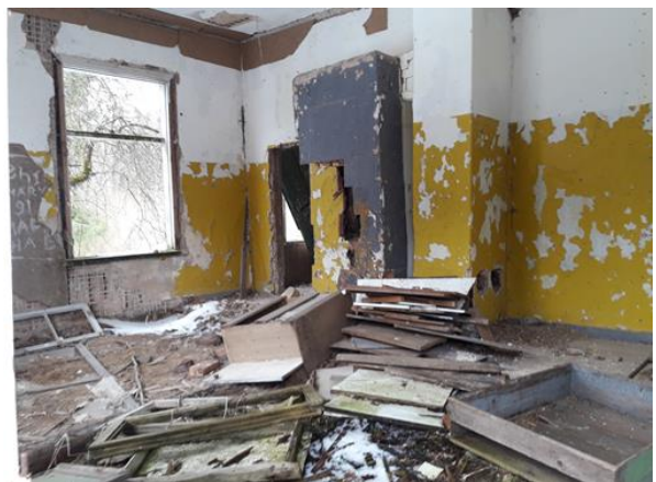
Foto 21. Hoone vaheseinad