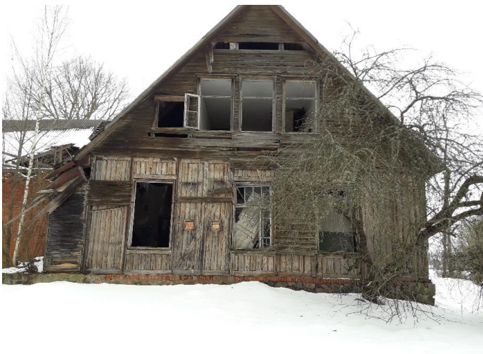
Foto 11. Kahjustatud fassaadi üldpilt