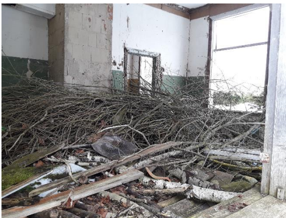
Foto 20. Hoone vaheseinad, autori foto

Vaheseinad on rahuldavas olukorras. (ill 20,21). Nendele toetuvad märgunud talad on maha kukkunud või ripuvad. (ill 16,17).