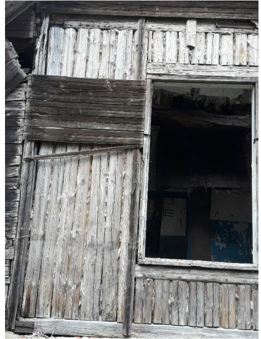
Foto 10. Sõrestiksein