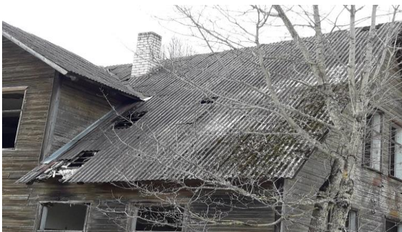
Foto 18. Neelukoht katusel

Katusetarindi lähemal uurimisel selgus, et kohtades, kus eterniitkate on säilinud, on ka puitelemendid kuivad ja kahjustusteta. Soovitav on säilitada ajastutruu vana tarind tervikuna: sarikad pennid, postid. Katuse aukude kohtadel vajavad puitsarikad läbikuivamist ja mõned tugevdamist. Augud katusel võib kinni katta sama mõõtu eterniitplaatidega. (ill 19). Vanu eterniitplaate võib leida jäätmejaamadest. Mõned eraisikud hoiustavad eterniitplaate kuuris, kuna selle utiliseerimine on väga kallid. Eterniitplaate on võimalik paigaldada hoone katusele tõstuki abil. Samas on vajalik üle kontrollida neelu- ja liitekohad.