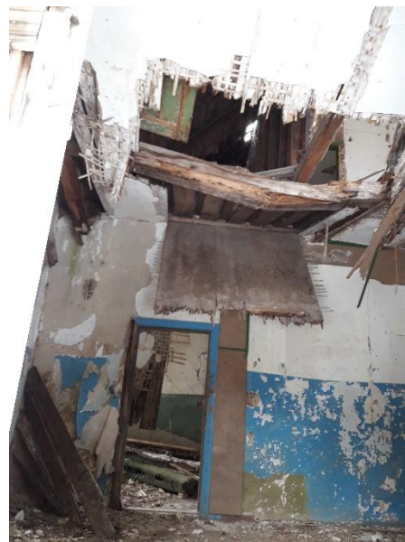
Foto 17. Sisse kukkunud talad

Katusetarindi lähemal uurimisel selgus, et kohtades, kus eterniitkate on säilinud, on ka puitelemendid kuivad ja kahjustusteta. Soovitav on säilitada ajastutruu vana tarind tervikuna: sarikad pennid, postid. Katuse aukude kohtadel vajavad puitsarikad läbikuivamist ja mõned tugevdamist. Augud katusel võib kinni katta sama mõõtu eterniitplaatidega. (ill 19). Vanu eterniitplaate võib leida jäätmejaamadest. Mõned eraisikud hoiustavad eterniitplaate kuuris, kuna selle utiliseerimine on väga kallid. Eterniitplaate on võimalik paigaldada hoone katusele tõstuki abil. Samas on vajalik üle kontrollida neelu- ja liitekohad.