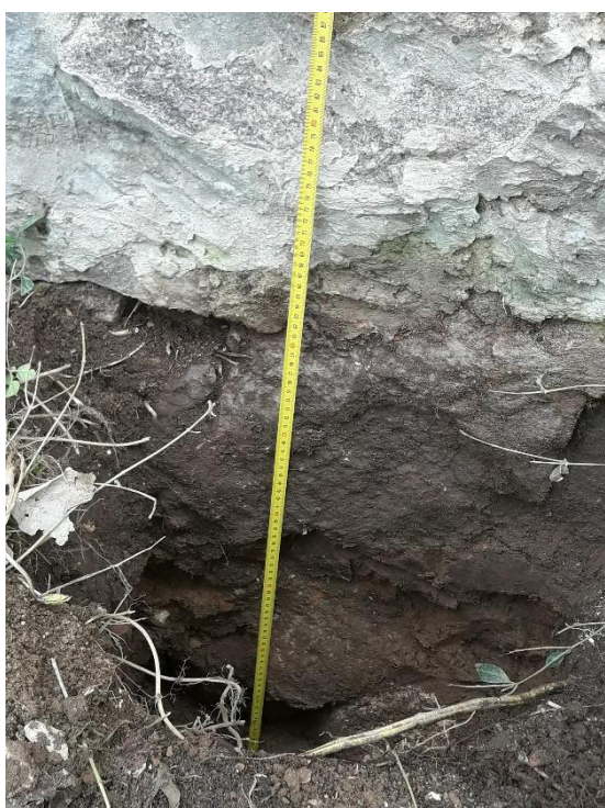
Foto 5. Vundament, autori foto

Vundamendist parema ülevaate saamise tagamiseks oli teostatud proovikaevand ehk vundament oli erinevatelt hoone külgedelt lahti kaevatud. Šurfikäigus selgus, et vundamendi kõrgus on 600 mm. (ill 5) Vundament ja ka hoone sokliosa koosneb maakividest ja nende vahed on segust tühjaks pudenenud. Hoone sein ääres sirgusid kõrged puud, mille juured kahjustavad ja kergitavad vundamenti. (ill 6) Lahtikaevamise käigus selgus ka, et vundamenti ümbritsev niiske pinnas koosneb taimedele meelepäraseks muutunud mullast ja ehitusjätmetest. Vihmaveesüsteemi puudumise tõttu pinnas märgus ja see on üheks vundamendi looklemise põhjuseks.