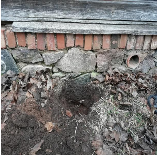
Foto 7. Sokli rahuldav seis, autori foto