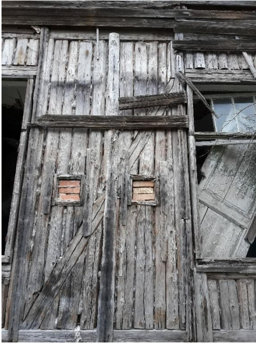
Foto 9. Sõrestiksein