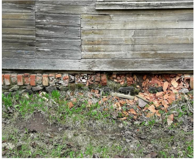
Foto 8. Sokli kahjustatud osa

Kivide väljakukkumise vältimiseks tuleb nende vahed täita mördiga. Punast telliskivi peab kaitsma tsingitud tilgapelekiga.