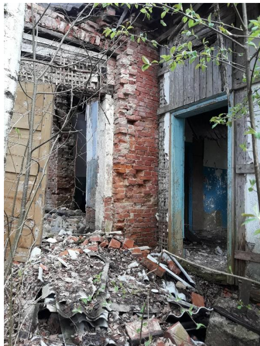
Foto 15. Avatud avatäited, autori foto

Kõik hoone avatäited tuleb sulgeda eelnevalt puidukaitsevahendiga töödeldud vineerplaatidega. Vineerplaat on tugev ja peab kaua vastu.