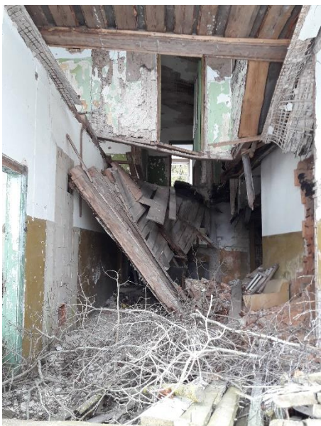
Foto 16. Sisse kukkunud talad

eemaldamine ning seda nii esimesel kui ka teisel korrusel. Tormituuled ja tuuletõmbus said eterniitkattele saatuslikuks. Pidev märgumine läbi aknaavade ja katuse vähendas hoone puitelementide ehk talade kandevõimet ja need kukkusid alla. (ill 16.17). Lisaks sellele on katusele väljaehitatud vintskapp, mille neelukoht on alati olnud riskialdis. (ill 18).