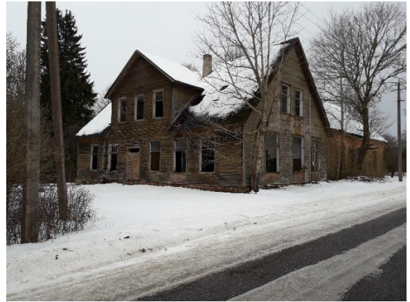
Foto 13. Sõrestiksein

Teised majaküljed on kaetud voodrilauaga, seega on tagatud sõrestikseina kaitse. (ill 12,13)