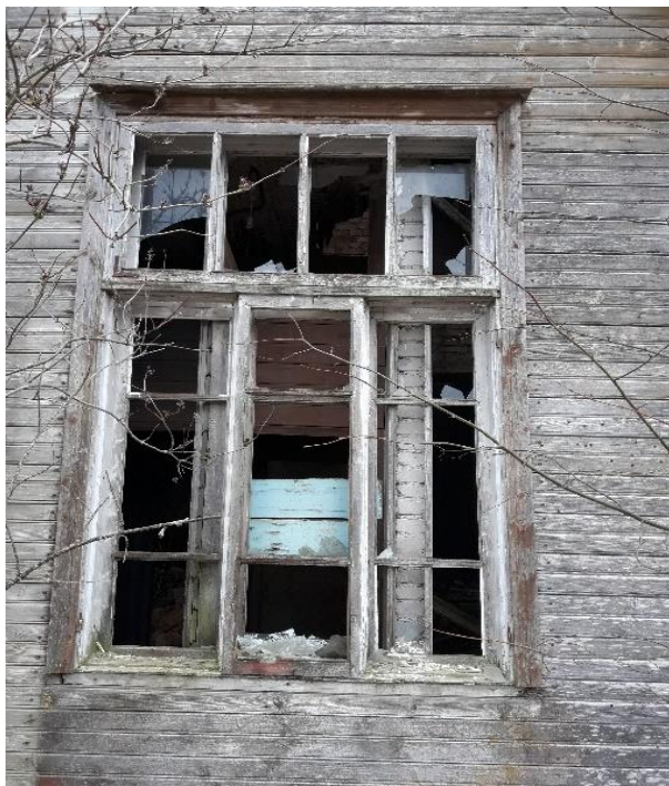
Foto 14. Katkised aknad

Hoone aknaraamid on säilinud, kuid puuduvad klaasid. (ill 14). Uste puudumise tõttu on hoonesse võimalik vabalt siseneda. (ill 15). Lastele sisenemine tekitab ohtlikke olukordi. Kool on täis rämpsu ja puuoksi, mida on võimalik kergelt põlema panna.