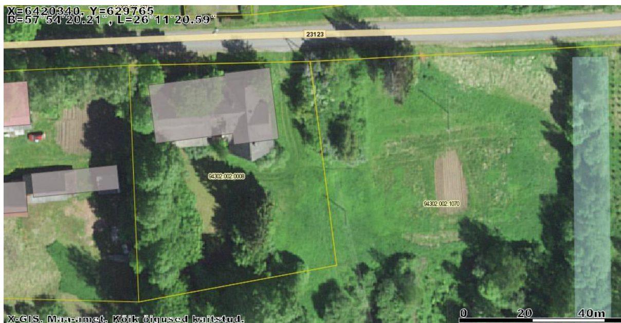
Foto 1. Hoone asukoht.

Endise Õru algkooli hoone asub Valgamaal (ill 1). Valga vald sai selle hoone omanikuks tänu Eesti omavalitsuste haldusreformile, mis sai teoks 2017. aastal. Enne seda haldas pikemat aega maja Õru vallavalitsus. Õru vallavalitsus üritas korduvalt hoonet müüa, kuid kõik üritused nurjusid.