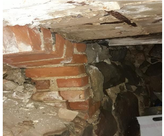
Foto 23. Kelder

Hästi on säilinud kuivkäimla puidust WC-pott. (ill 24).