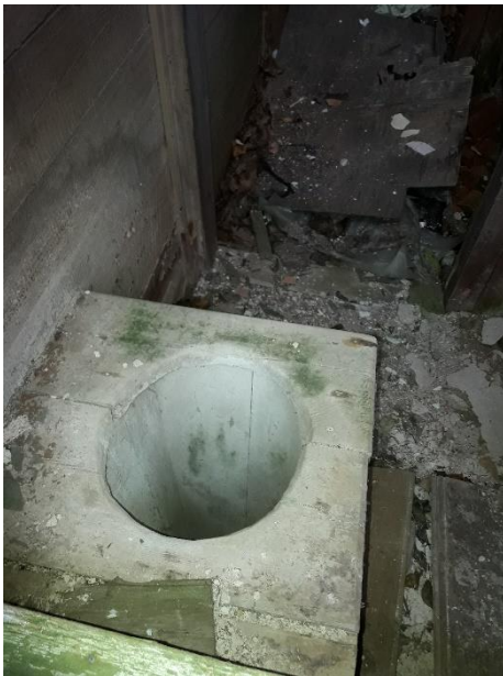
Foto 24. Puidust WS pott

Hästi on säilinud kuivkäimla puidust WC-pott. (ill 24).