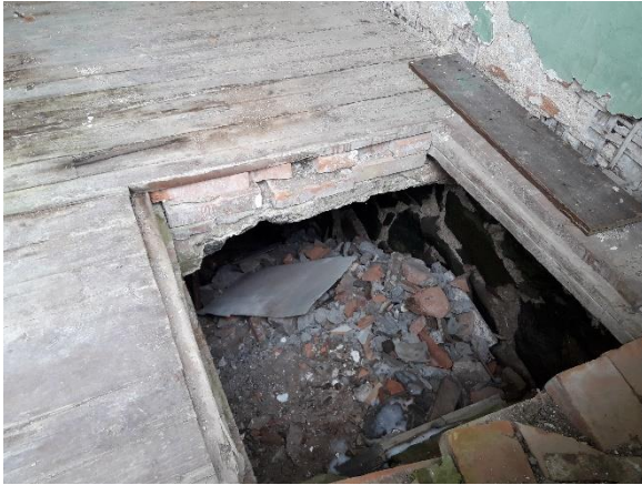
Foto 22. Kelder

Koolihoones on kelder, mis on avani prügikotte täis. Tehtud piltidelt on näha, et maakividest sein on suurepäraselt säilinud. (ill 22,23).