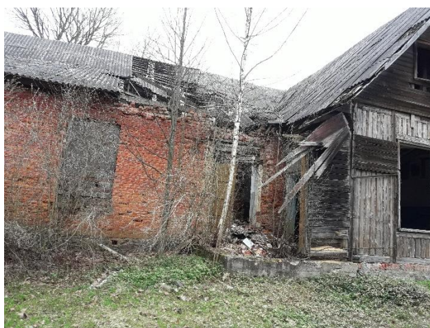
Foto 6. Puud ja põõsad ümber maja

Konserveerimistöõde läbiviimisel on vajalik eemaldada kõik hoone sein läheduses kasvad puud, võimaluse korral, kännud maha freesida.