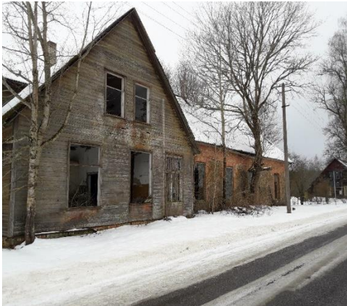
Foto 12. Sõrestiksein