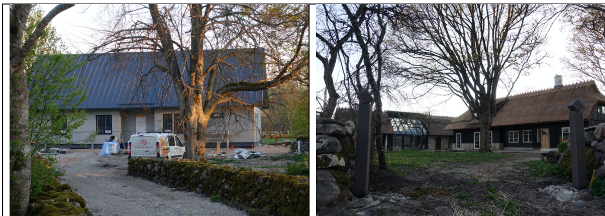
Illustratsioon 2 - Hooned miljööväärtuslikul hoonestusalal (näited 1 ja 2).