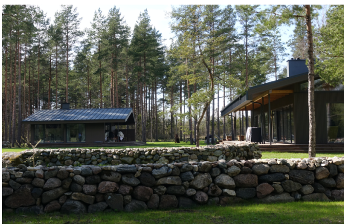
Illustratsioon 3 - Hoone Oina külas näide 3.

Asendiplaani, tehnovõrkude- ja rajatiste, teede, platside, logistika, haljastuse ja väikevormide lahendus peab olema esitatud nii plaaniliselt kui ka kõrguslikult ja seotult geodeetilise süsteemiga ning arvestama teiste samal maa-alal paiknevate objektidega. Selleks tuleb eelnevalt koostada geodeetiline alusplaan. Tiigi kohta esitada lisaks asendiplaanil kajastatud asendilisele paiknemisele piki- ja põiklõige tiigi mahu kirjeldamiseks. Elamu ja sauna arhitektuurne lahendus vastavalt projekteerimistingimuste taotluse juurde lisatud eskiislahendustele. Vt ill 2.