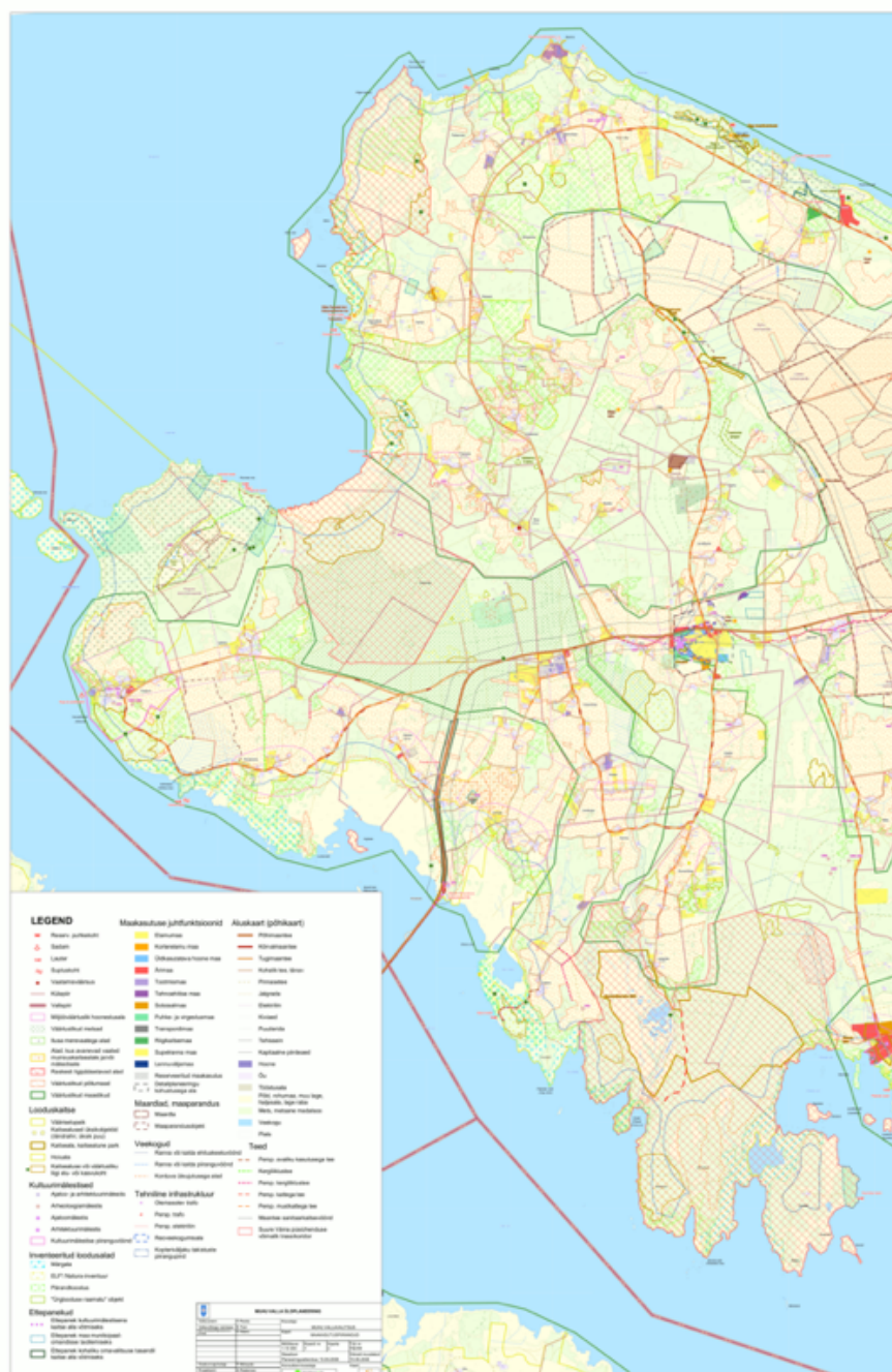
Illustratsioon 4 Muhu valla üldplaneering (vasakpoolne osa) 2008.