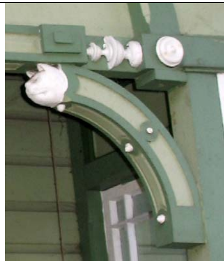
Kuessaare, pärna 56