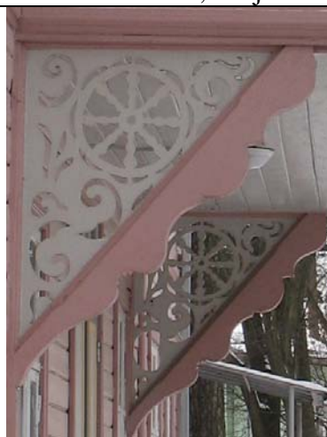
Tallinn, Mai 2