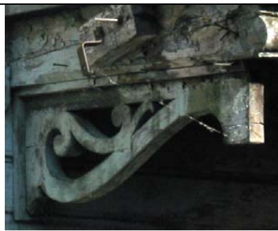
Haapsalu, Vaikne kallas 17 (rõdu)