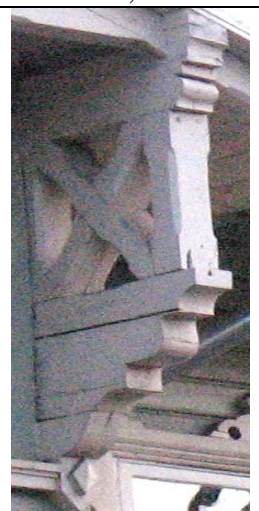
Tallinn, L. Koidula 12A