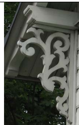
Tallinn, J. Poska/Vesivärava nurgal