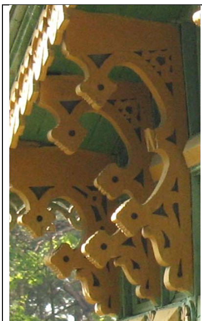
Narva-Jõesuu, Aia 45