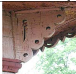
Aegviidu raudteejaama hoonetekompleks, pagasikuur