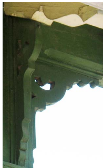
Haapsalu, Posti 17