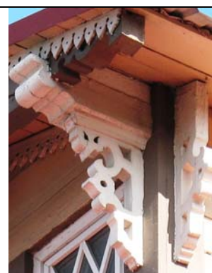
Tallinn, Toompuiestee 18/ Falgi 1