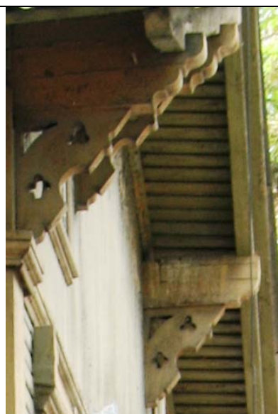
Tallinn, L. Koidula 16