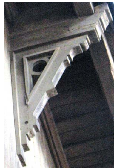
Tallinn, Vana-Kalamaja 11A/ Tööstuse