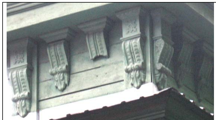
Pärnu, Pikk 24 (torn)