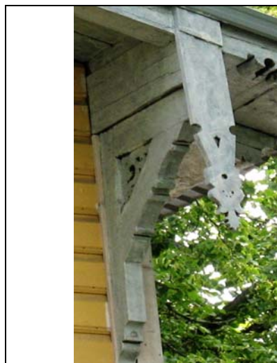
Tallinn, Koidula 20