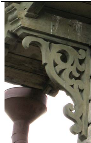
Tallinn, Wismari 3