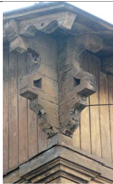
Tallinn, Soo 15/ Vana-Kalamaja