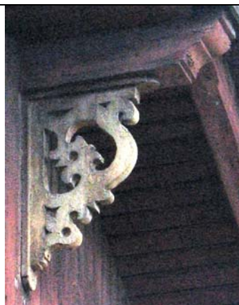
Tallinn, Kõie 6