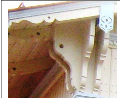
Paldiski raudteejaam (avati 1870.a.)