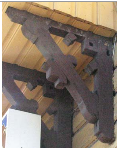
Tallinn, Kopli tn./Vabriku 1 (II k rõdu)