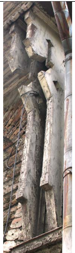
Tallinn, Poska 41 (arh. A. Fedotov, 1884.a.)