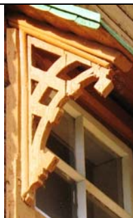
Ida-Virumaa Kuremäe kirik