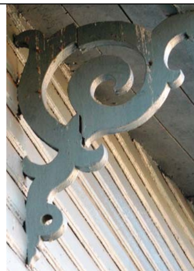
Paide, Pärnu tn 12