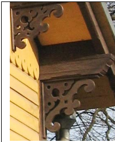
Tallinn, Toompuiestee 10