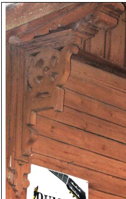
Ida-Viru maa, Alajõe