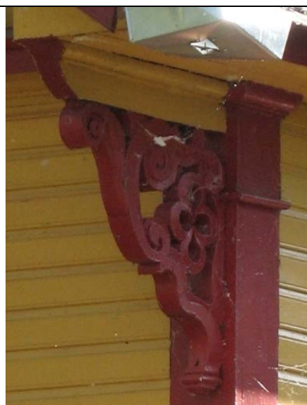
Haapsalu, Promenaadi 6