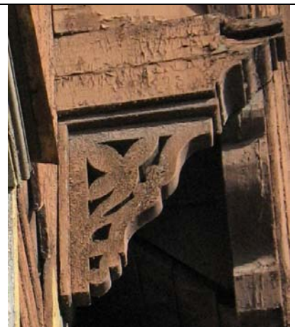
Tallinn, Niine 10 (arh. K. Wilcken, 1893. a.)