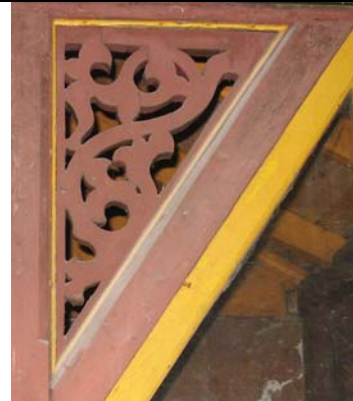
Tartu, Vallikraavi 13 (veranda)