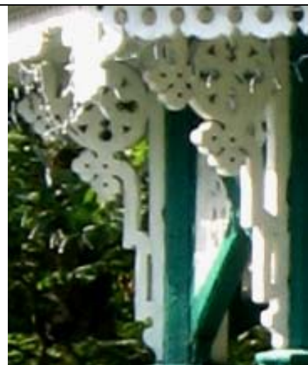
Narva-Jõesuu, Hele Park (paviljon)