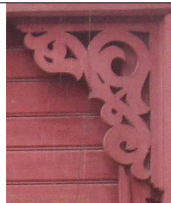
Tartu, Tähtvere 5 (veranda)