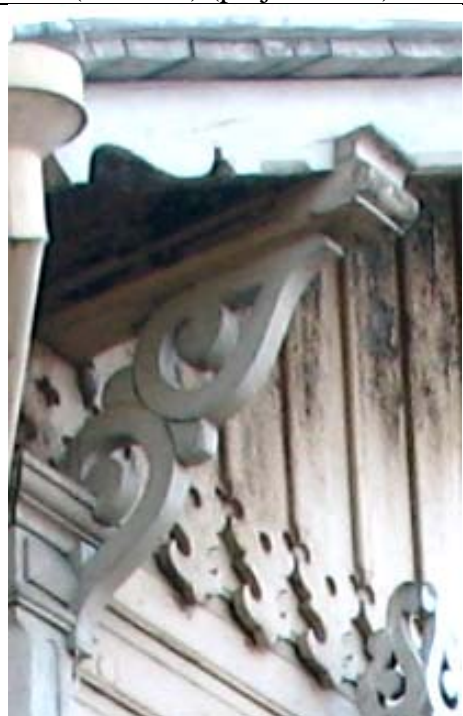
Haapsalu, Posti 20