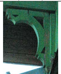
Tallinn, Küti 3