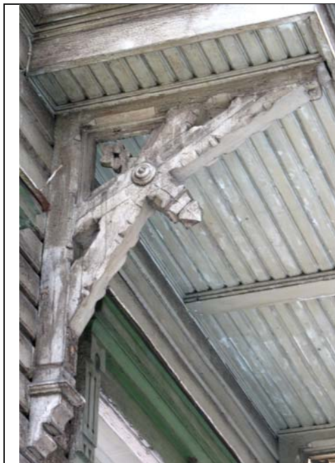
Tallinn, Pärnu mnt 123 (1882.a.)