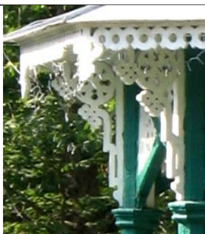
Narva-Jõesuu, Hele Park (paviljon)