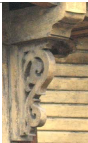
Tallinn, Vesivärava 20