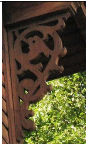
Tallinn Malmi 10/Kopli 22