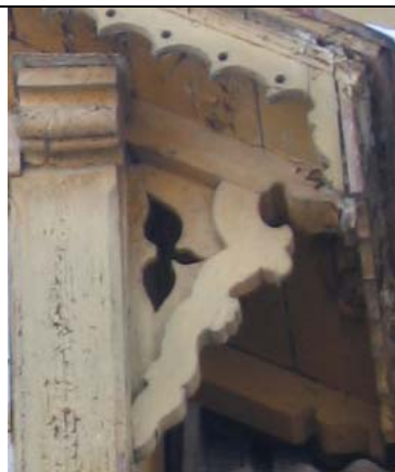
Särevere mõis (vintskapp)