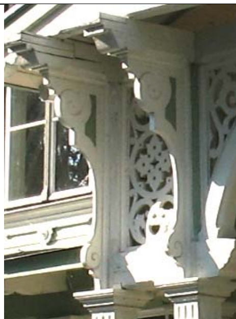
Haapsalu, Promenaadi 4 (kuursaal) (proj. 1897.a.)