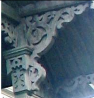
Narva-Jõesuu, Pargi 6