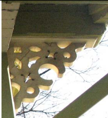
Tallinn, Falgi tee 3/ Toompuiestee