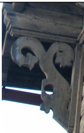
Tallinn, A. Adamsoni 17