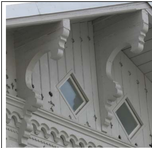
Tallinn, Koidula 24