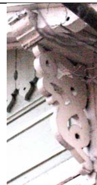
Tallinn, L. Koidula 12A