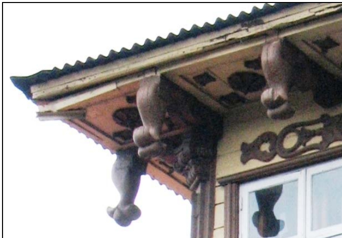
Pärnu, Pikktn 20