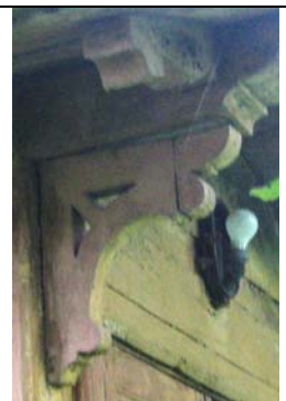
Paldiski, Adamsoni 3 (1896.a.)