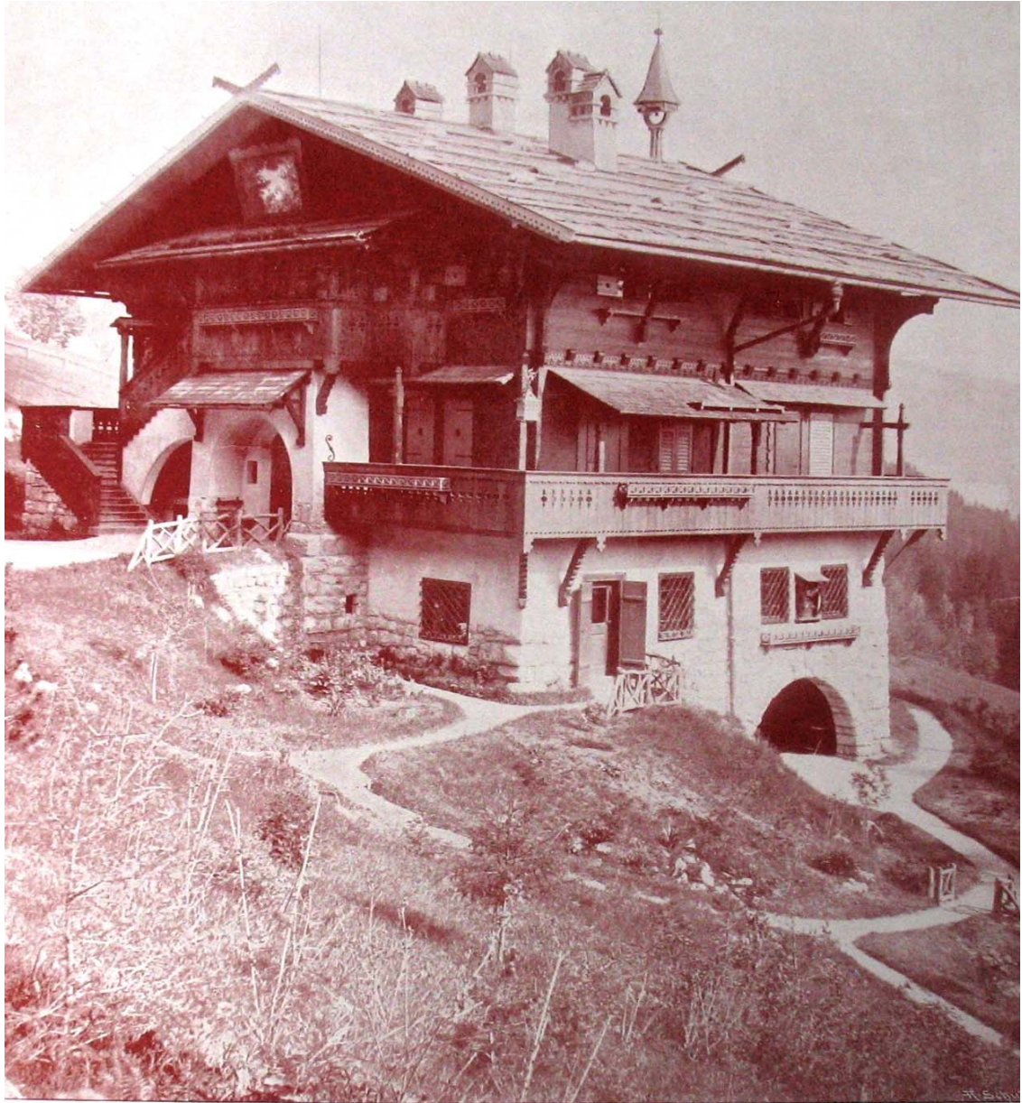
Villa am Semmering, N.-Ö. Grundrisse im Textblatt.

Lisa 1.5 Carl Zetsche „Einfache Land- und Stadthäuser“, 1902, Stuttgart