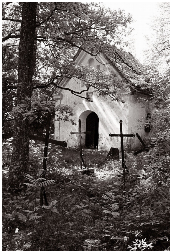
3. Historitsistlik kabel Adavere mõisa kalmistul, 1963. aastal. 7