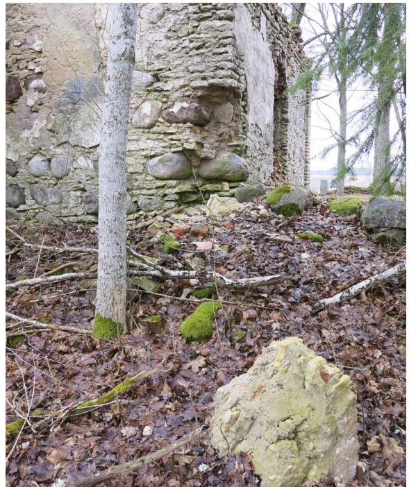
20. Lagunenud nurgad kabeli lääneküljel.