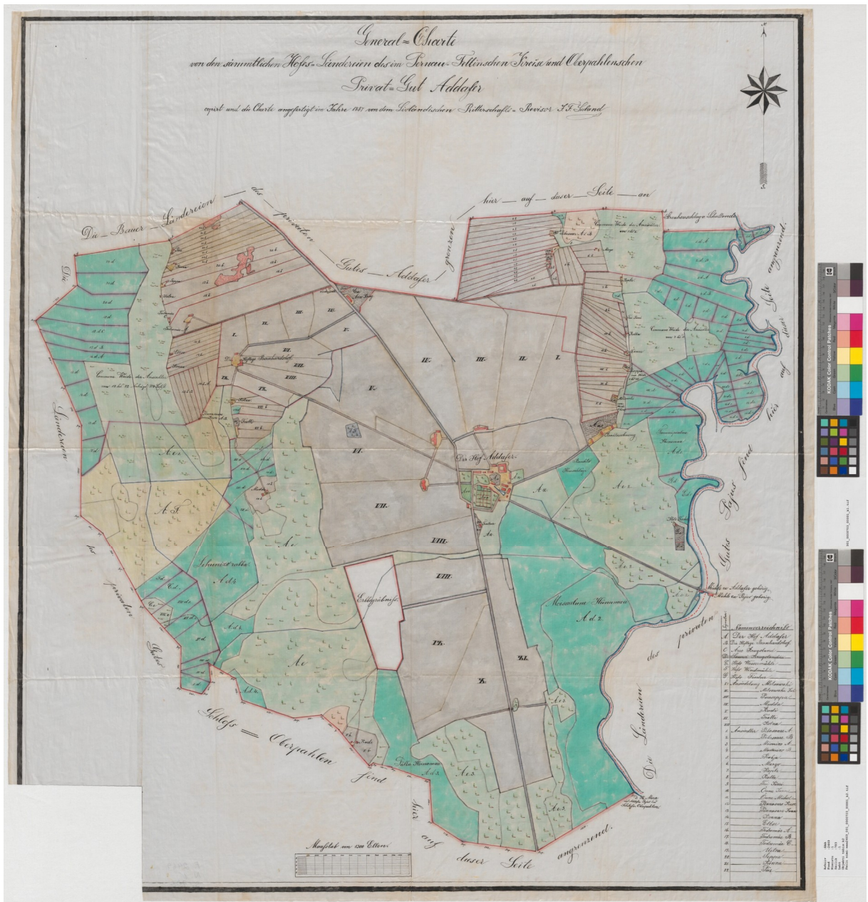
5. J. F. Seeland, 1887.a. , Adavere mõisa maad. Perekonnakalmistu (erbbegräbnifs) on märgitud punase joonega ümbritsetud valge alana. 8