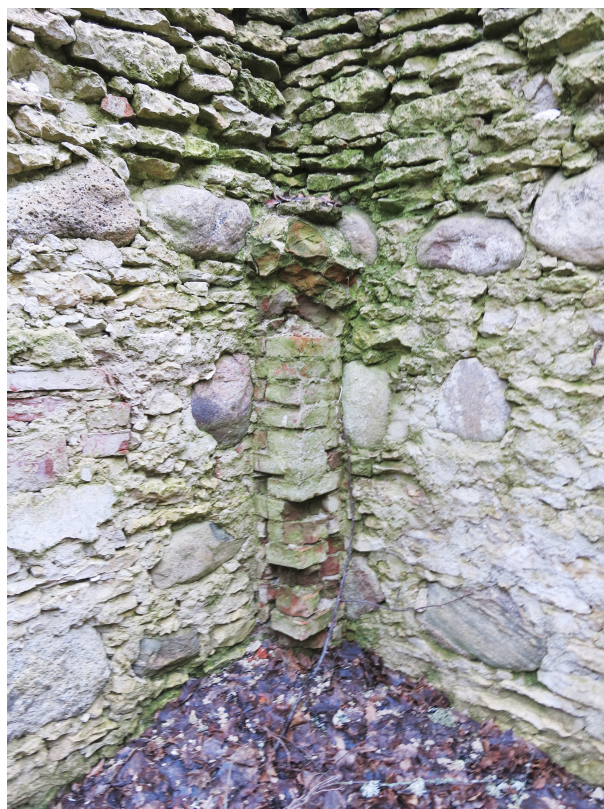
18. Kabeli sisenurk.