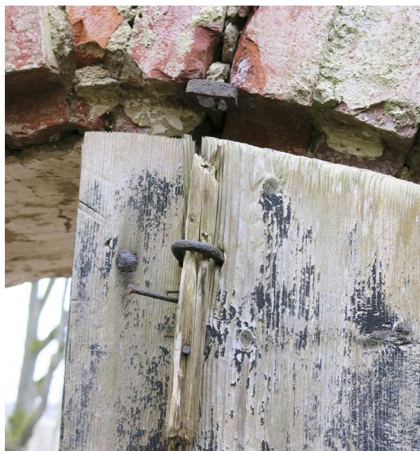
24. Sepistatud vastus ukseriivile.