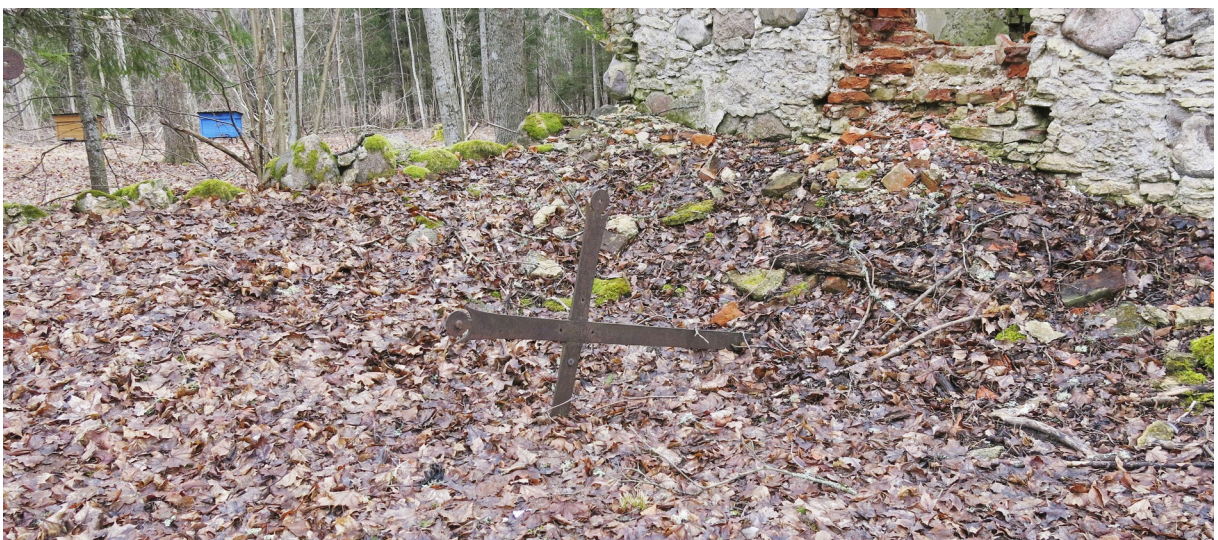
11. Üks kahest raudristist kabeli lõunaküljel.