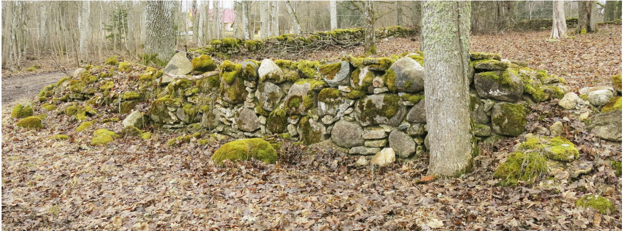
6. Kalmistu lõunapoolset osa ümbritsev kivimüür.