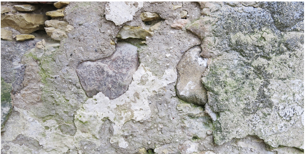
21. Fragmendid läänefassaadi krohvist. Näha on kahte erinevat krohvikihistust, millel on kohati säilinud valget lubivärvi.