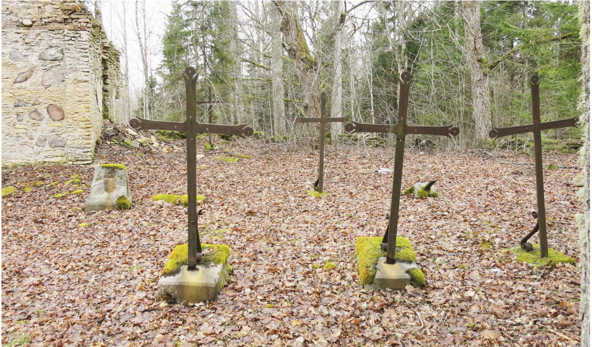
12. Matmispaik kabelist põhjapool.