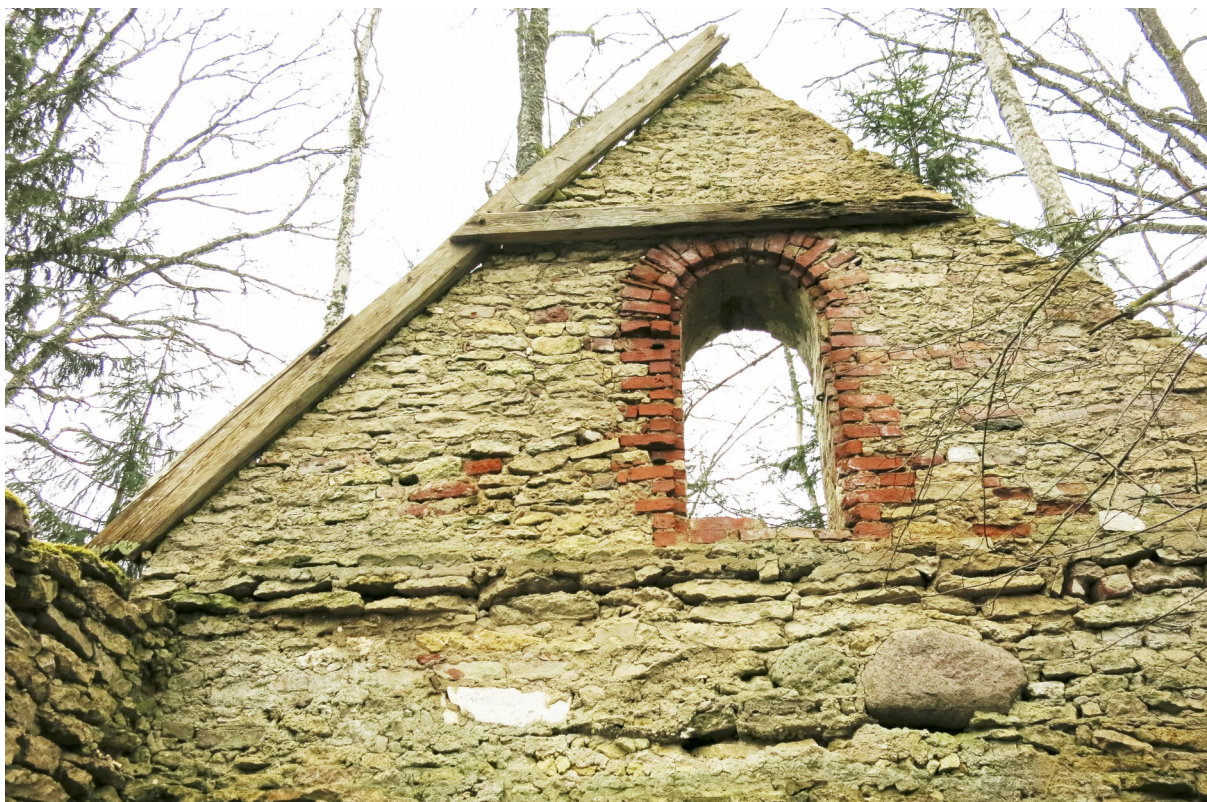
19. Sarika ja penni fragmendid kabeli lääneviilul.