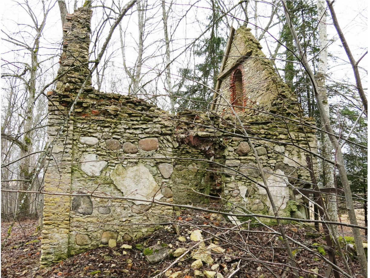
16. Kabeli põhjakülg.