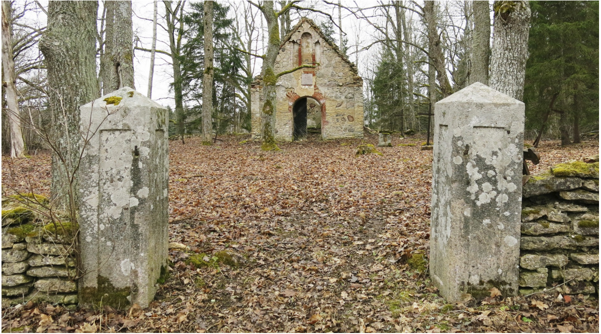
9. Graniidist tahutud postid kalmistu väravas.

Kalmistu esine ala on olnud piiratud madala maakivikuhjatisega ja selle eest algas allée, mis viis välja Tallinn-Tartu maantee. Alles on kaks kalmistupoolset põlist tamme (ill 10). Siseallee, mis viis väravast kabelini, on hävinud. Alleed markeerivad üks puu ja mõned kändud. 10