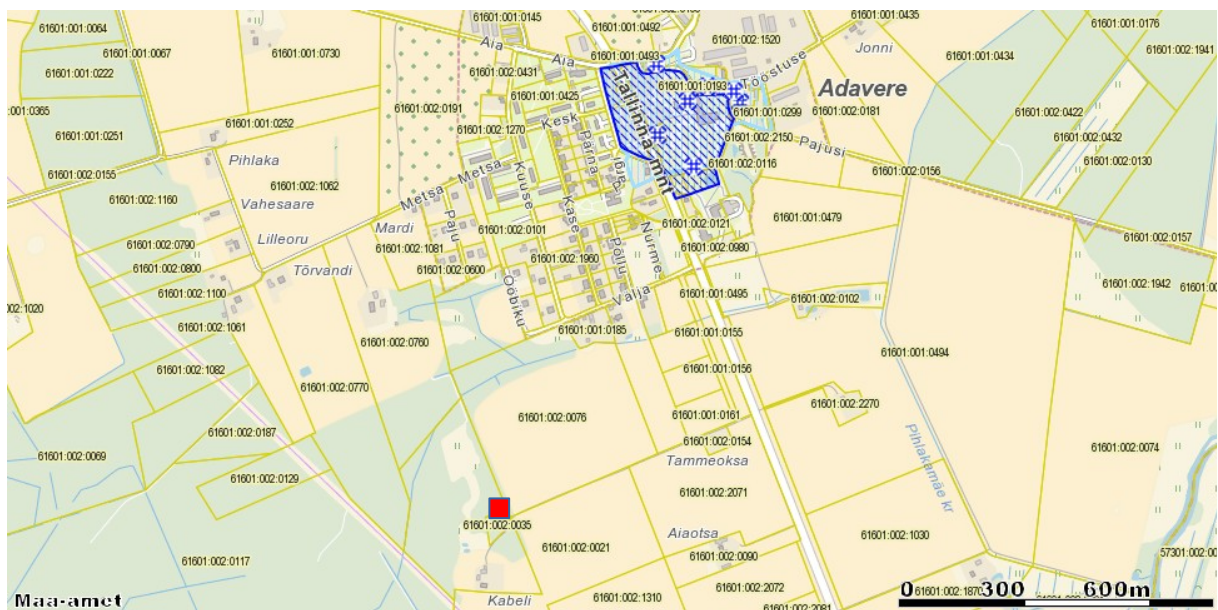
1. Punase ruuduga on märgitud kalmistu asukoht. 2