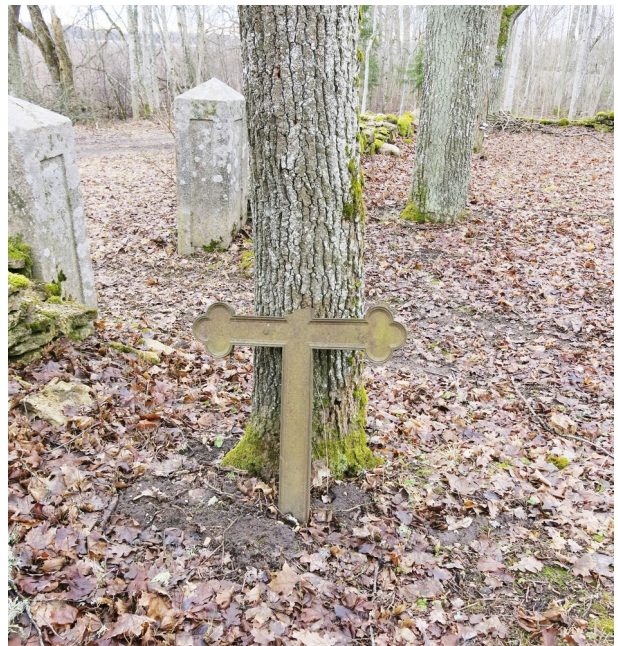
13. Ristikivilt eemaldatud malmrist.