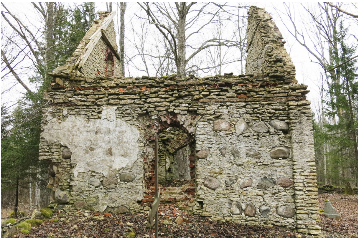
15. Kabeli lõunakülg.