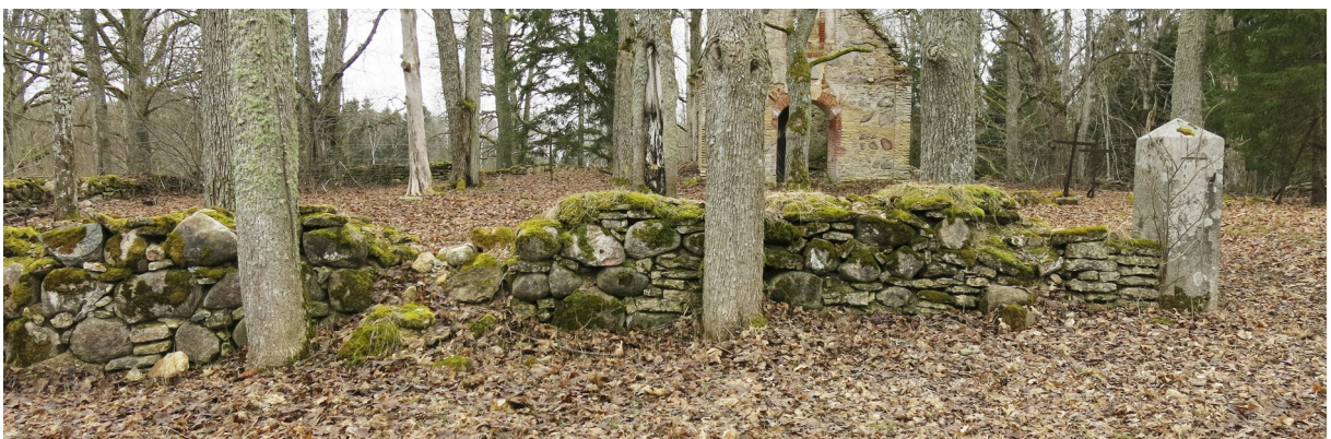
8. Müür lõppeb graniidist väravapostiga.