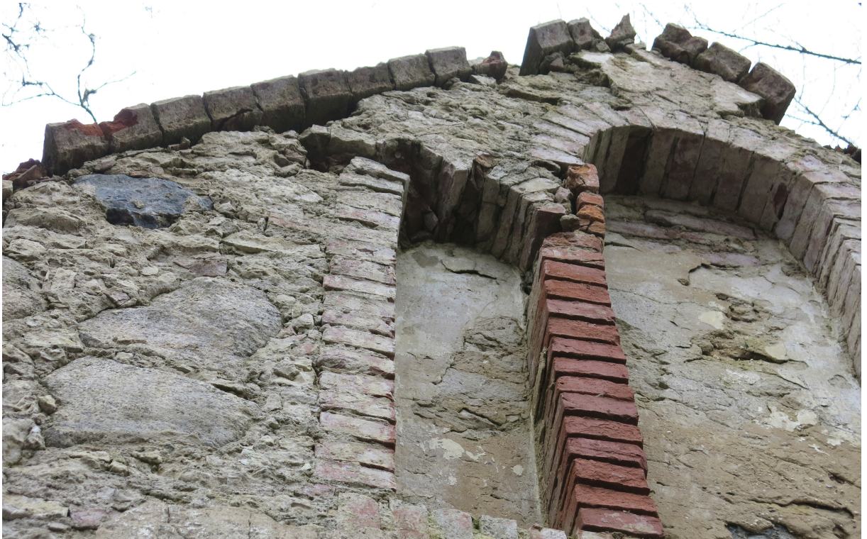
17. Tellisekasutus karniisil ja niššidel.