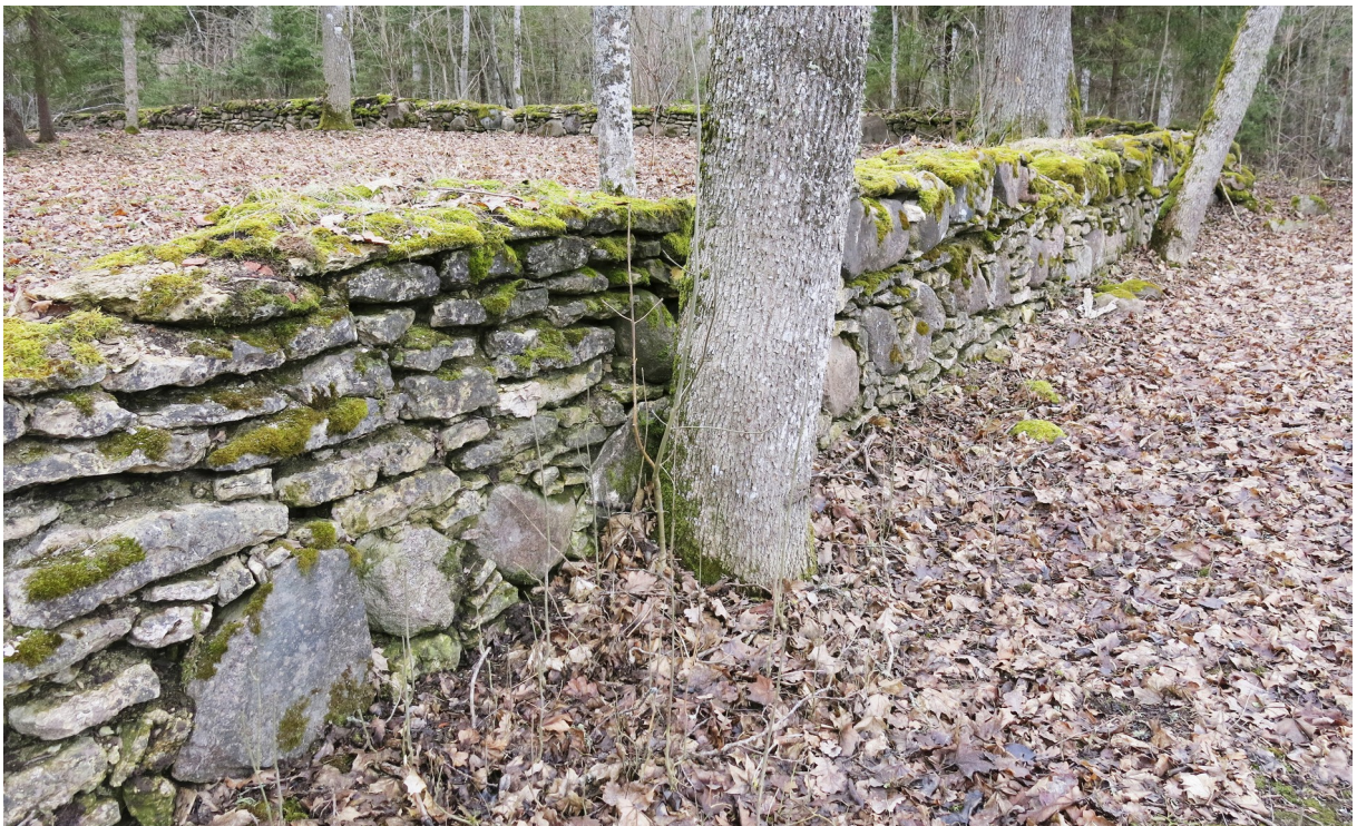
7. Kalmistu põhjapoolset osa ümbritsev kivimüür.