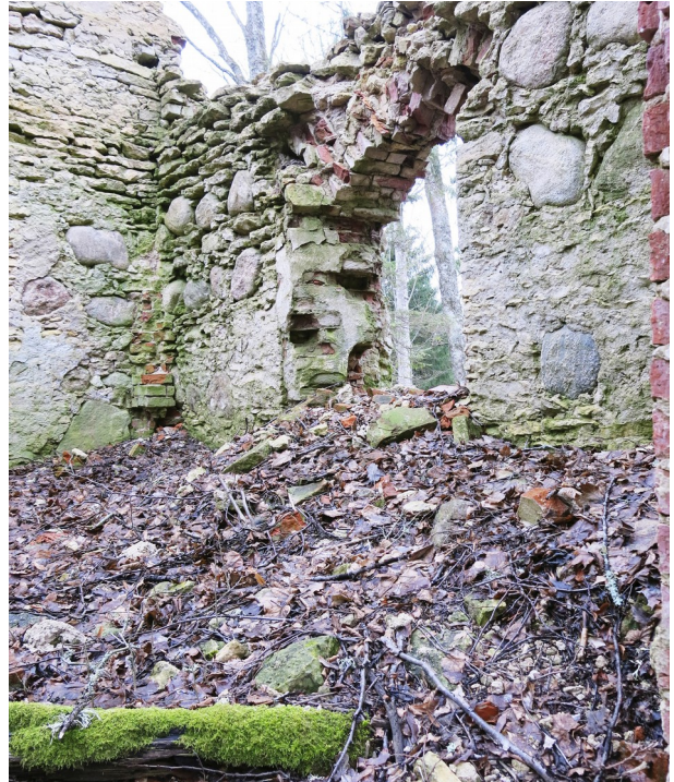
22. Sodihunnik kabeli sisemuses.

1963. aasta fotodelt on näha, et hoonet kaunistas tellistest viilukarniis, millest nüüdseks on säilinud vaid fragmendid. Detailidest on alles portaali kohal olevad kolm tellistest laotud ümarmkaarset nišši, millest lagunenu on kahe äärmise silluskaare mõningad tellised. Esiuksest on alles üks halvasti säilinud romblaudisega uksetiib, mida hoiavad müüri küljes sepistatud latthinged (ill 23). Samuti on säilinud ukseriivi vastus ja mõningad sepanaelad (ill 24). Ukse kohale on müüritud aastaarvuga (1777) graniidist tahvel, mis on säilinud hästi.