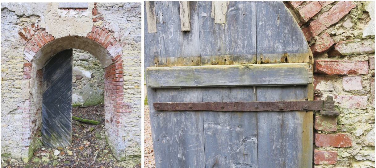
23. Säilinud, romblaudisega, uksepool ja ülemine latthing.

1963. aasta fotodelt on näha, et hoonet kaunistas tellistest viilukarniis, millest nüüdseks on säilinud vaid fragmendid. Detailidest on alles portaali kohal olevad kolm tellistest laotud ümarmkaarset nišši, millest lagunenu on kahe äärmise silluskaare mõningad tellised. Esiuksest on alles üks halvasti säilinud romblaudisega uksetiib, mida hoiavad müüri küljes sepistatud latthinged (ill 23). Samuti on säilinud ukseriivi vastus ja mõningad sepanaelad (ill 24). Ukse kohale on müüritud aastaarvuga (1777) graniidist tahvel, mis on säilinud hästi.