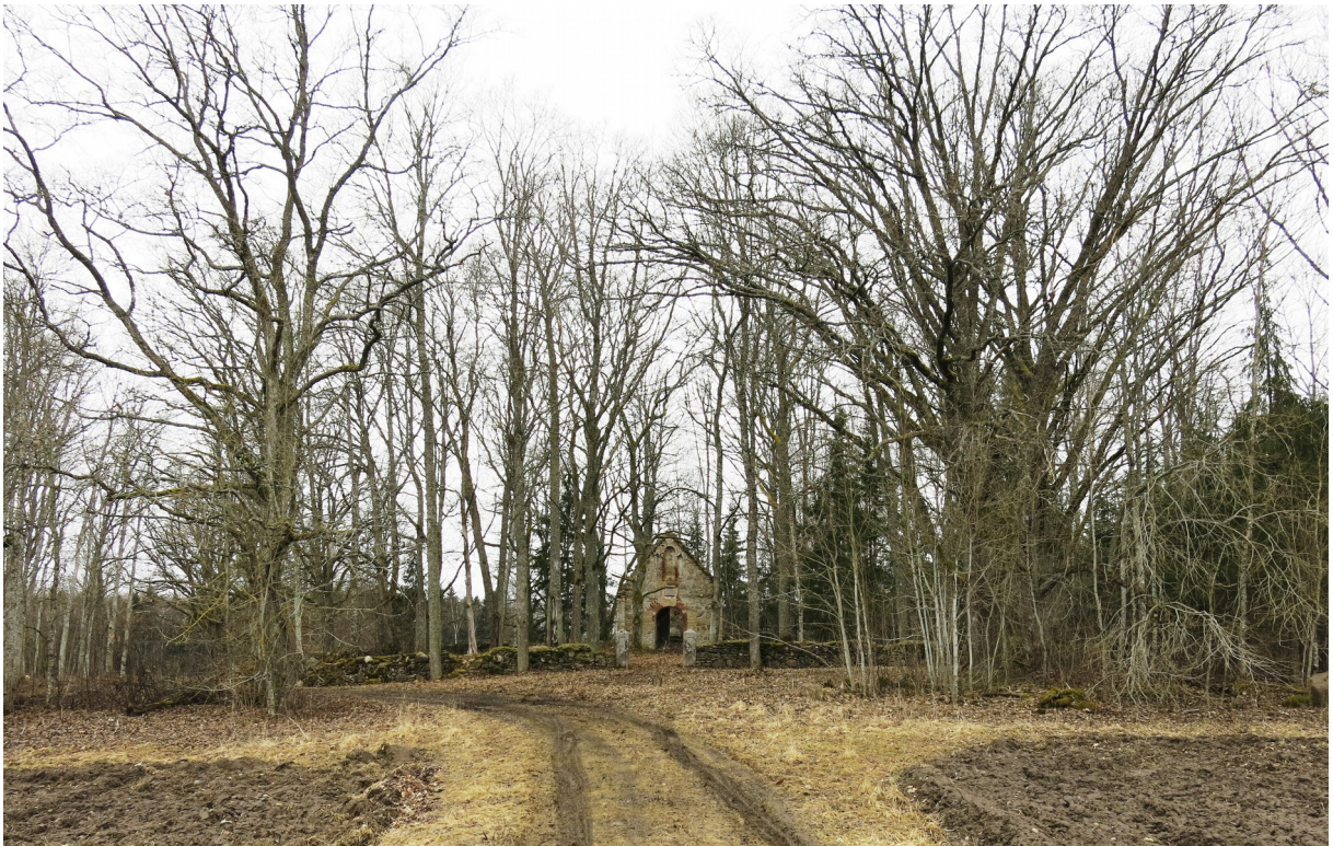
10. Vaade kalmistule ja alleed markeerivatele põlistammedele.

Kõverdunud ja murdunud hauatähiste ning kaduma läinud detailide puhul on suure tõenäosusega tegemist vandalismiga.