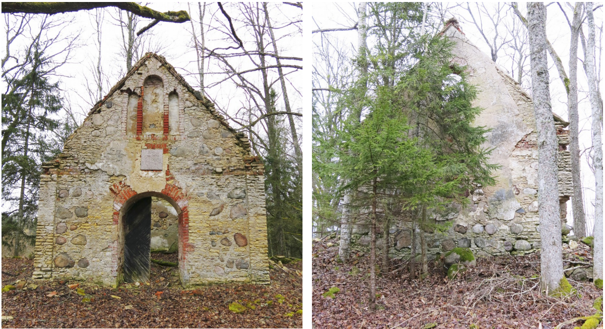
14. Vasakul: kabeli idafassaad. Paremalt: kabeli läänekülg.