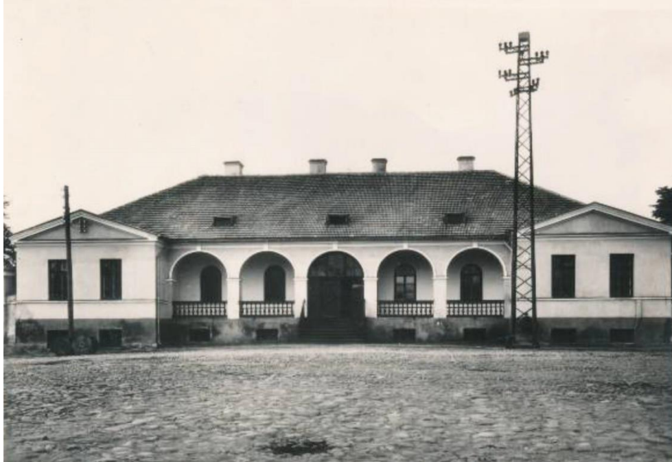
Foto 47. Tartu postijaam.